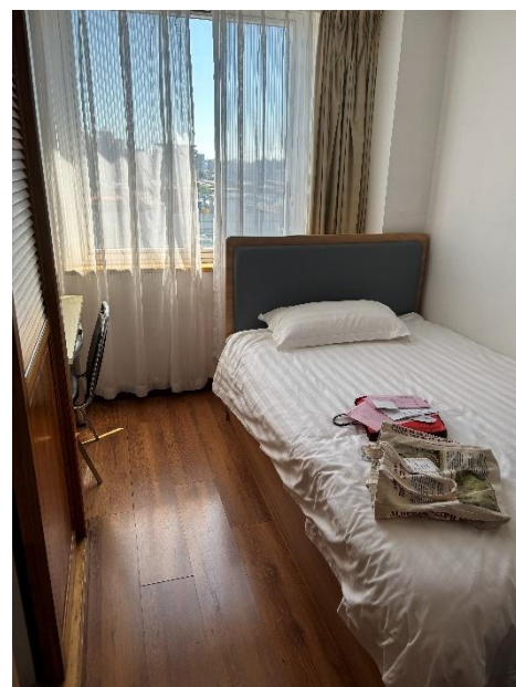
北師大提供之國際留學生宿舍， 港澳台被歸類在國際學生