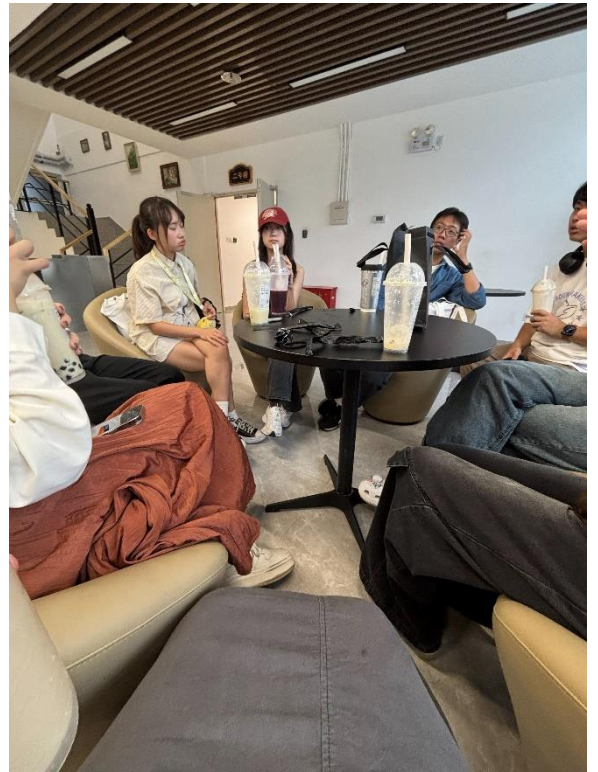
與來自台灣其他高校的交換生