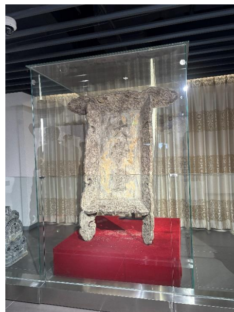
北師大校史館內留存之清朝京師 大學堂匾額