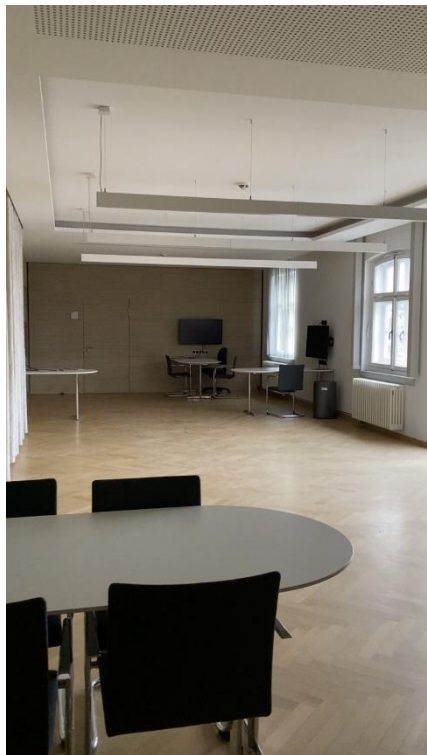
學校裡可以用來讀書和討論的公區