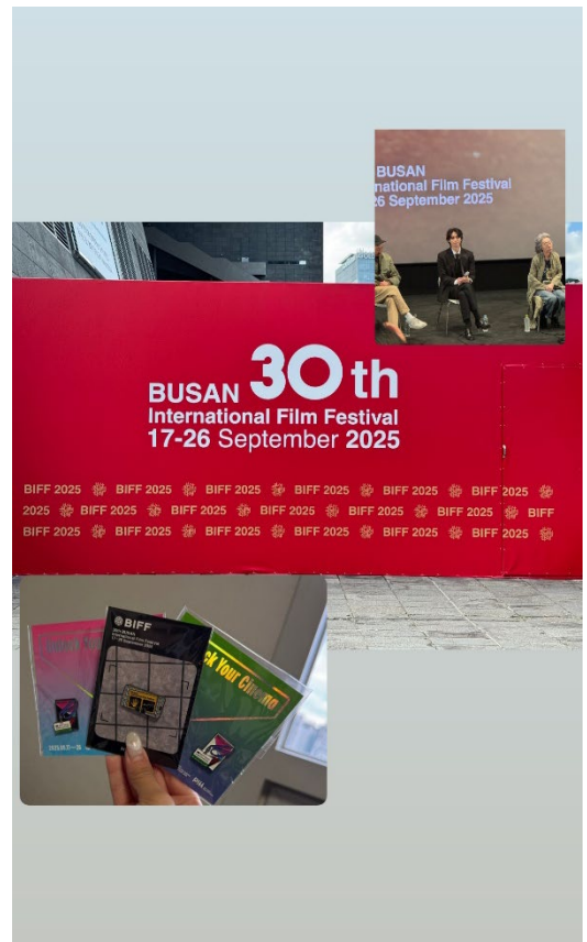
釜山電影節!!去得太衝動 所以都沒安排好行程嗚嗚嗚