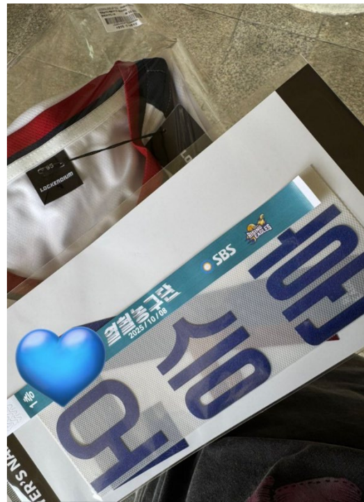
明星籃球賽的錄製