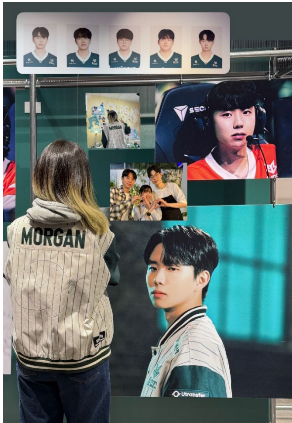
和室友一起追電競!