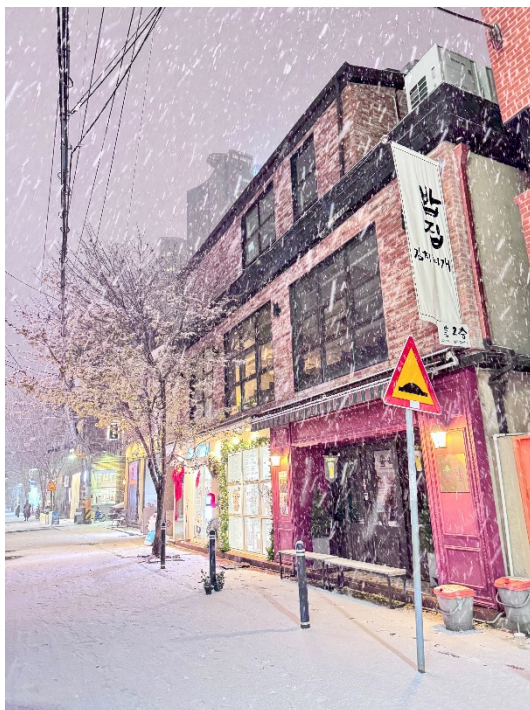
25년 첫눈 ❄️ 그날도 어김없이 뮤지컬 보러 갔음ㅋㅋ