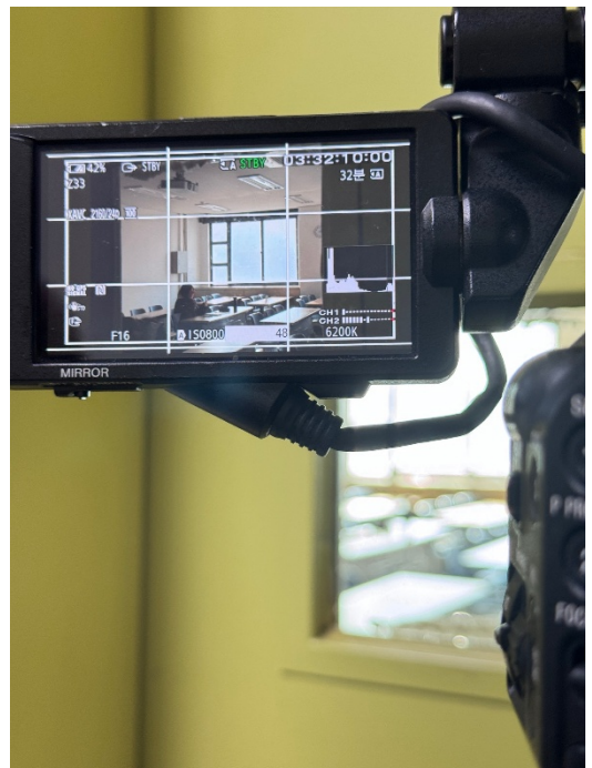
協助他人的作品拍攝 其實是我第一次真正接觸片場