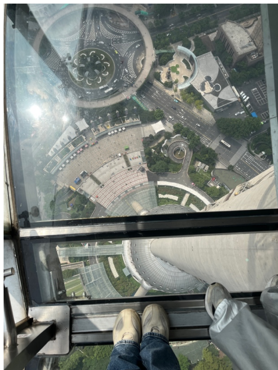
港澳台辦舉辦上海體驗日 參觀東方明珠透明觀景台