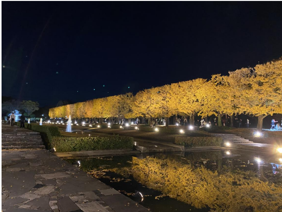
國營昭和公園 夜晚散步銀杏大道