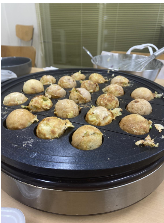
台灣人聚會做章魚燒