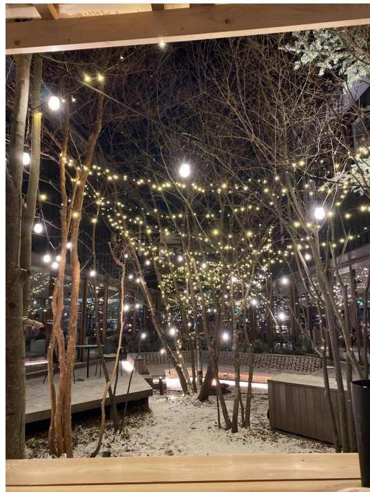
在青旅遇下雪漂亮夜景