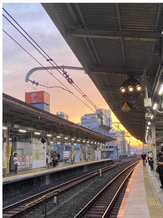
等車時夕陽下的車站