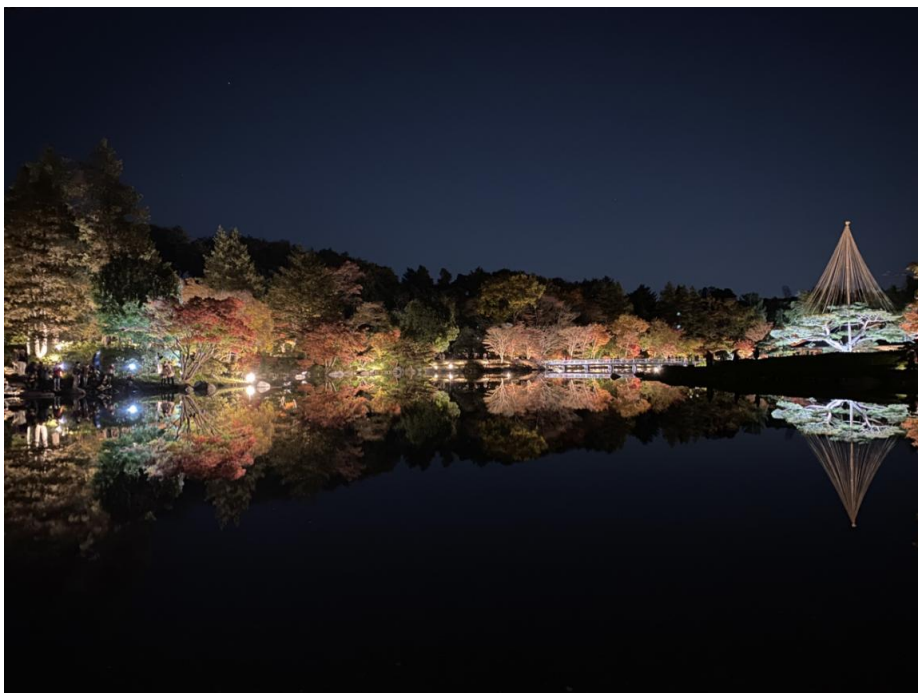
國營昭和公園 日本庭園池景倒影