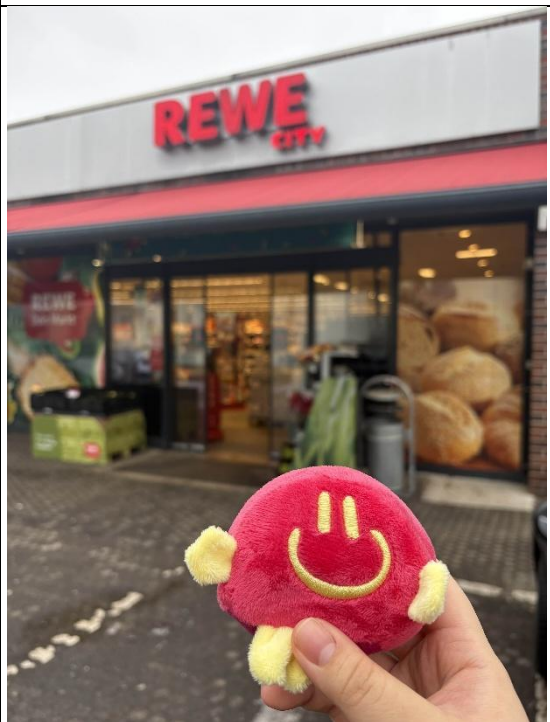
德國 REWE 超市吉祥物