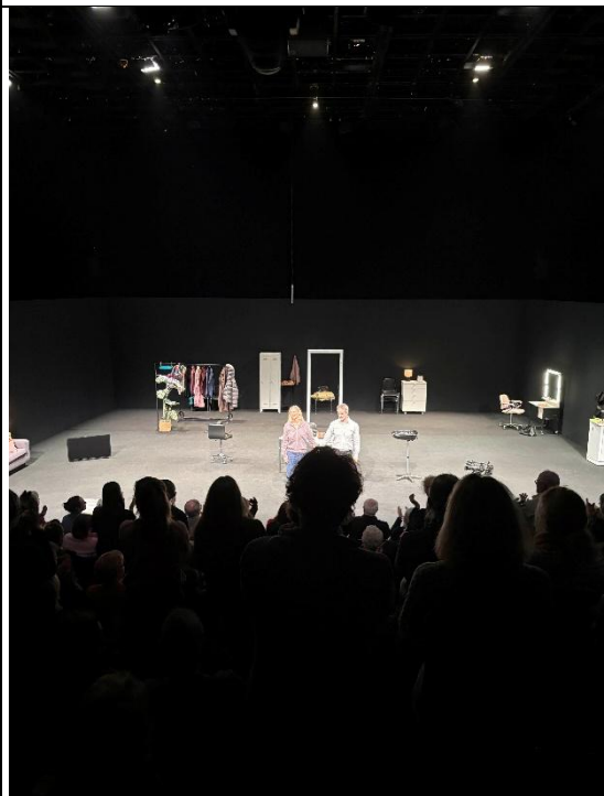
在柏林第二喜歡的演出 Schaubühne 的《Changes》 兩位演員飾演 23 個角色