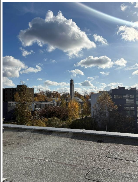
Studentendorf Schlachtensee 宿舍房間窗外風景