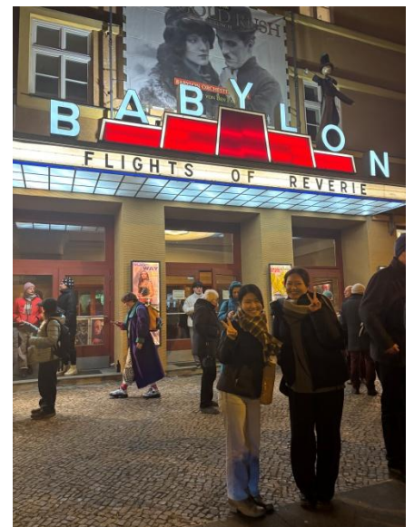
巴比倫電影院上映的卓別林默劇