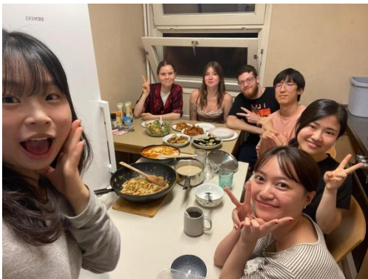
與WG室友們舉辦一人一菜活動