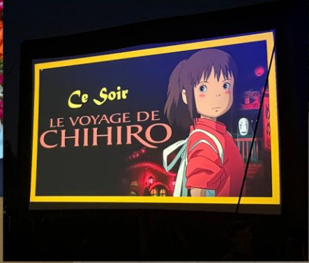
露天電影： 法文版千尋