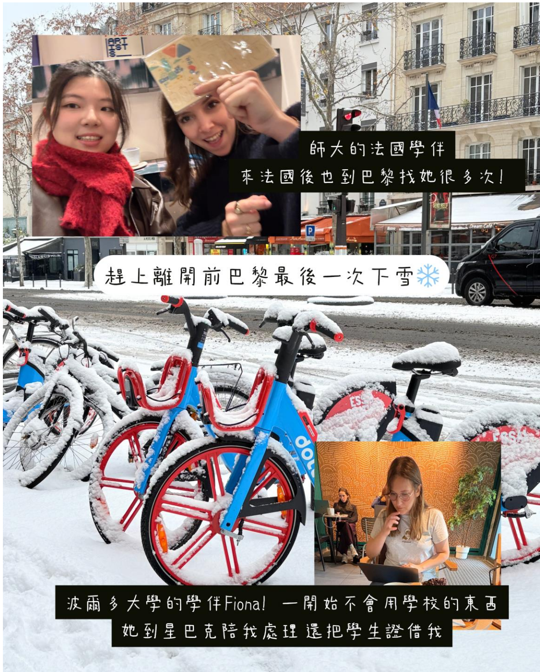
師大的法國學伴 來法國後也到巴黎找她很多次!