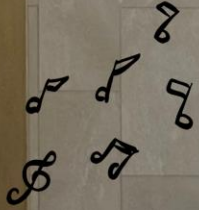
學期初Crous的迎新活動🎉