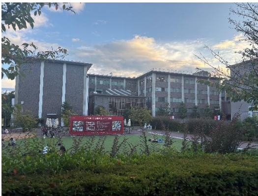
（圖一）學校內有片人工草坪，天氣好的時候可以看到不少人臥躺於此。