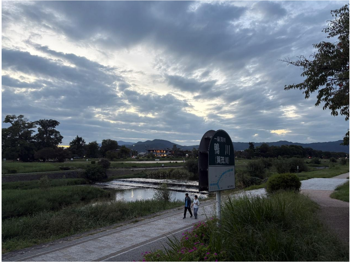
(圖三) 不少同學喜歡去走路散心的鴨川。