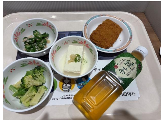
（圖二）學生餐廳每週都會換菜單，也有不少小菜副食可以選擇。