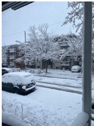
11月猝不及防的大雪