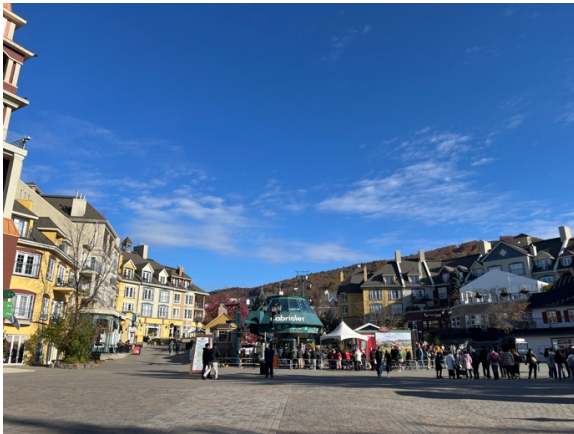
10月中的 Mont Tremblant