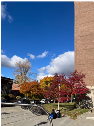
個人最喜歡秋天的校園