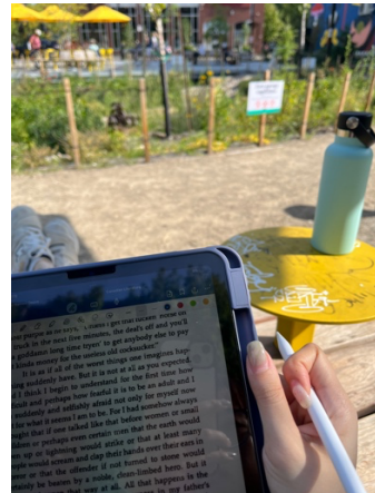
宿舍附近的小廣場很適合曬太陽