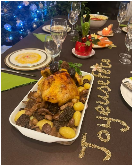
聖誕節在法國朋友家一起吃烤雞