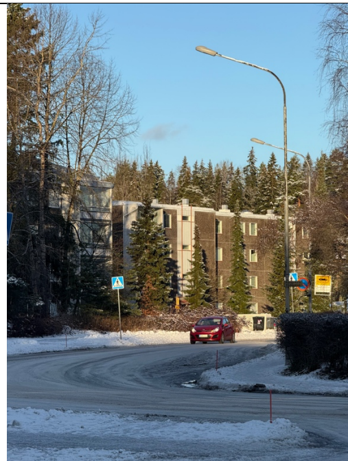
我美麗的社區風景