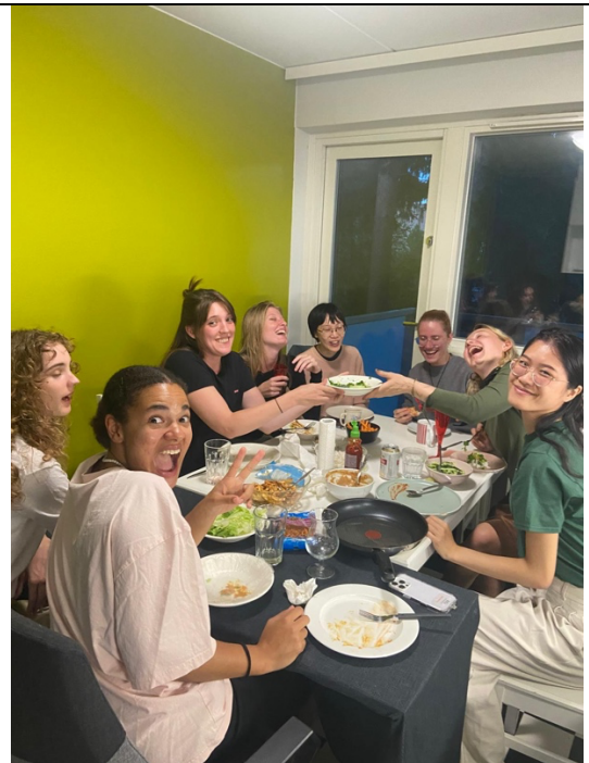
與交換生好友一同聚餐吃春捲