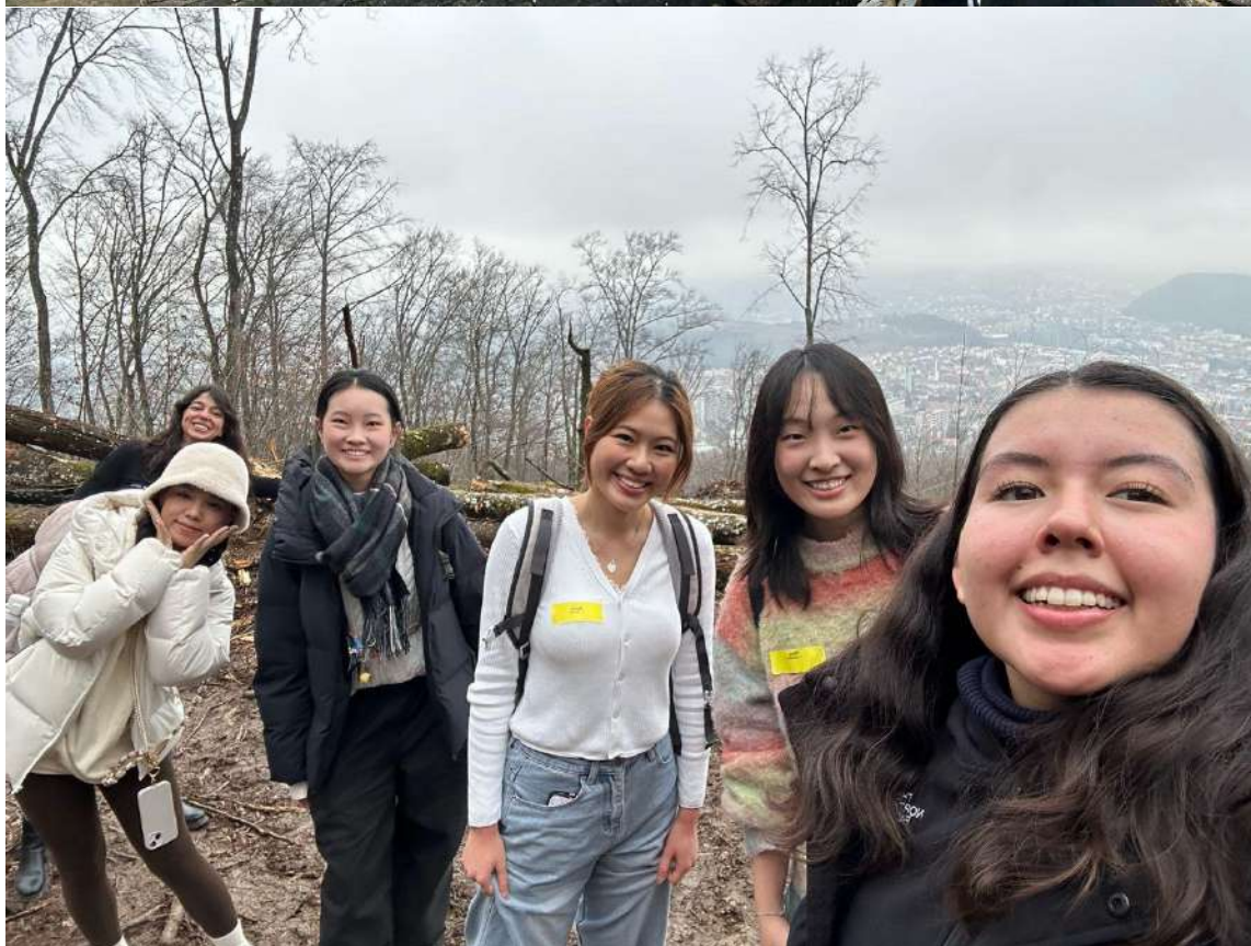
Welcoming week 的登山活動