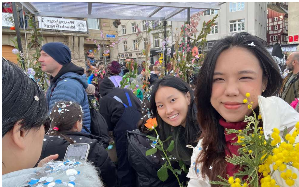
巴塞爾嘉年華 遊行