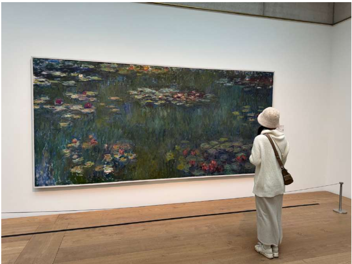
蘇黎世美術館 莫內的作品