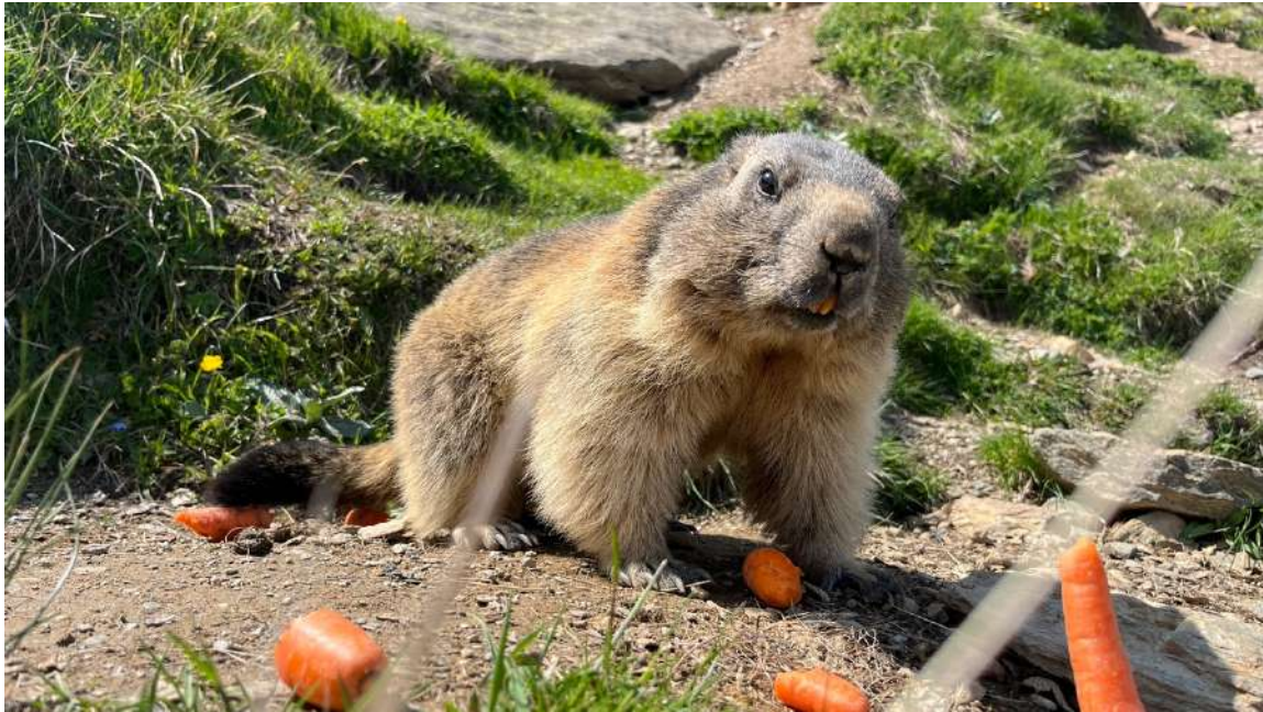
瑞士的土撥鼠步道