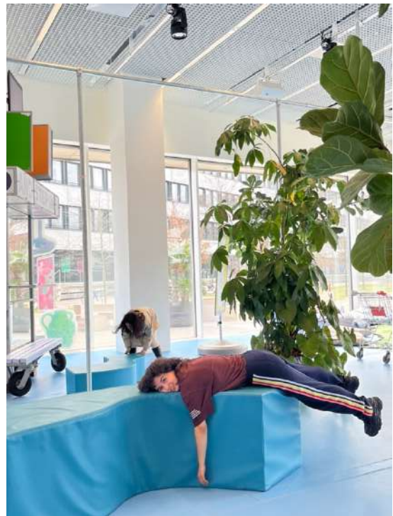
策劃互動式展覽的工作坊