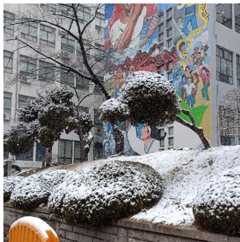
▲ 冬天的校園被白雪覆蓋