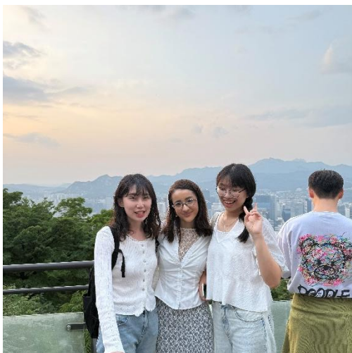
▲ 和慶熙BUDDY(學伴)去南山塔