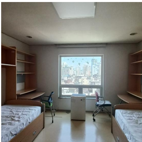
▲ 慶熙宿舍一世和園