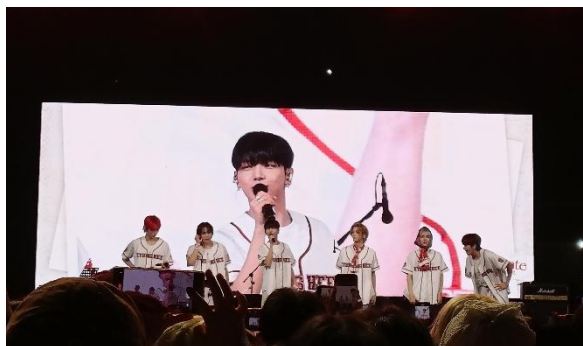
▲ 慶熙校慶(國際校區)