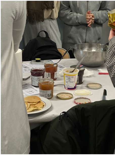
跟其他班級一起做crêpes