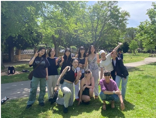
學期最後一堂課老師帶全班一起去公園野餐