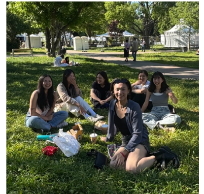
假日與同學們一起野餐