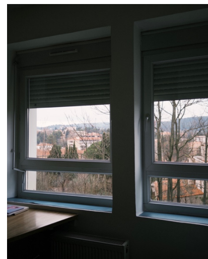
宿舍內部與外部環境