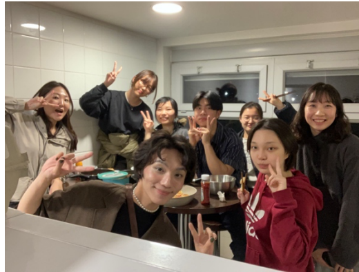
平日課後與班上的韓國同學一起煮飯