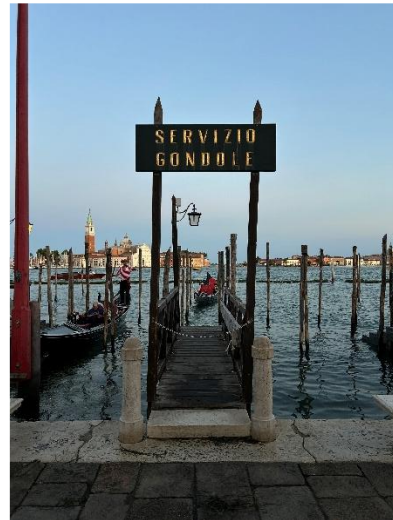
我想要再去義大利