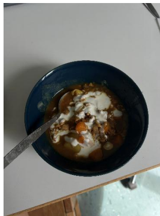
自己煮好吃的咖哩