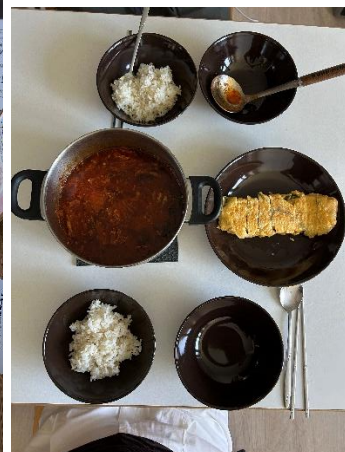
韓國朋友煮泡菜鍋給我吃