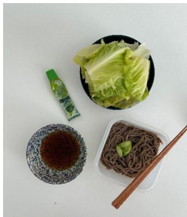
在宿舍自己煮飯的日子