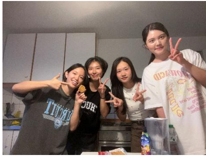
韓國朋友邀請我們吃韓式料理