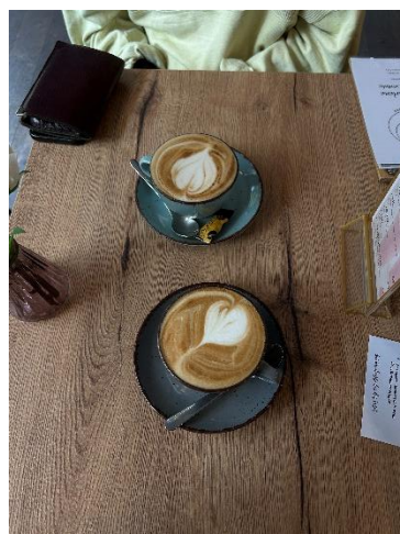
和德國學伴一起喝咖啡