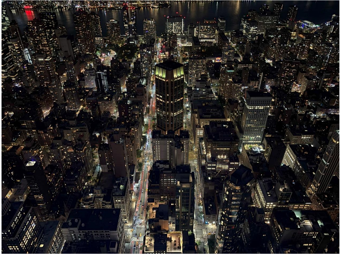
NYC from Empire Building