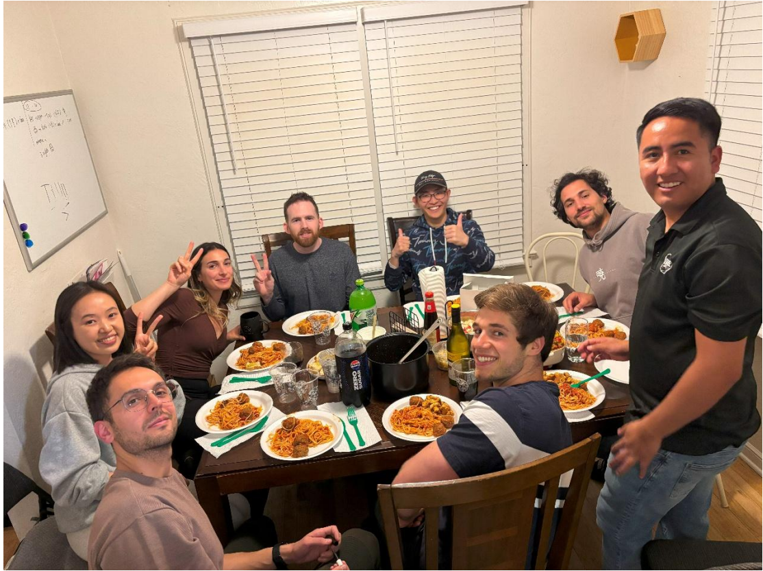
My best friends in Reno