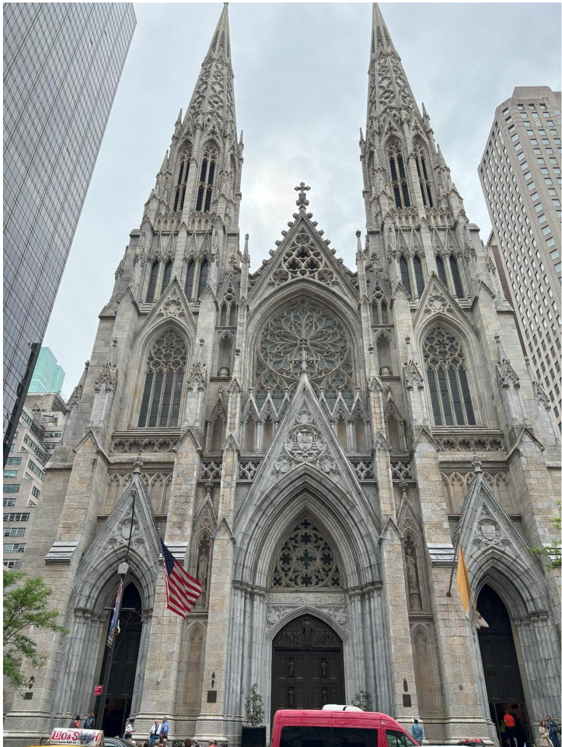
St. Patrick' s Cathedral