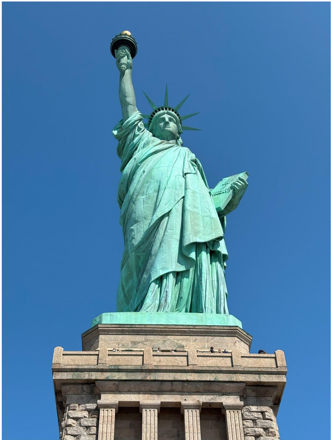
Statue of Liberty