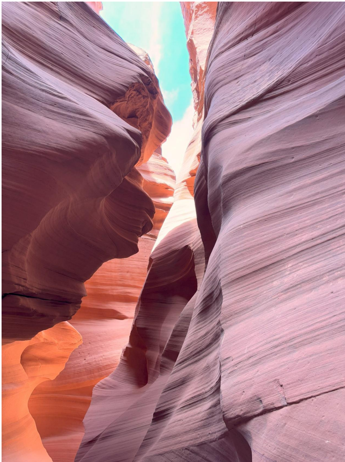
Antelope Canyon X