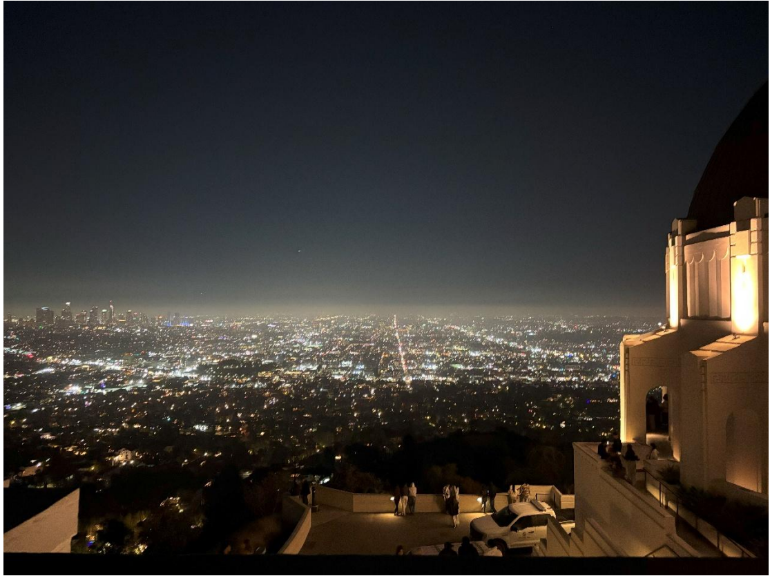
LA from City Observatory