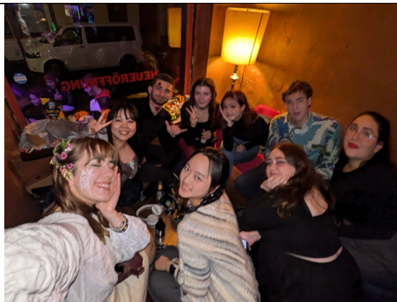
很幸運上下學期都遇到非常緊密的室友