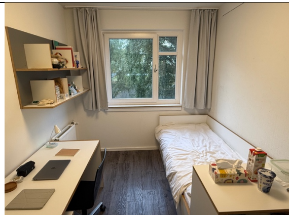
宿舍：單人雅房，每月€422