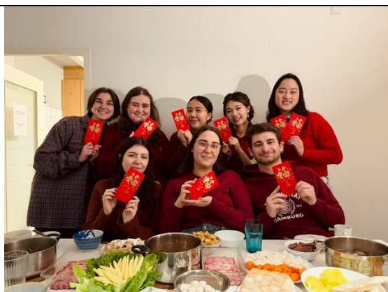
第一次除夕夜不是和家人一起度過