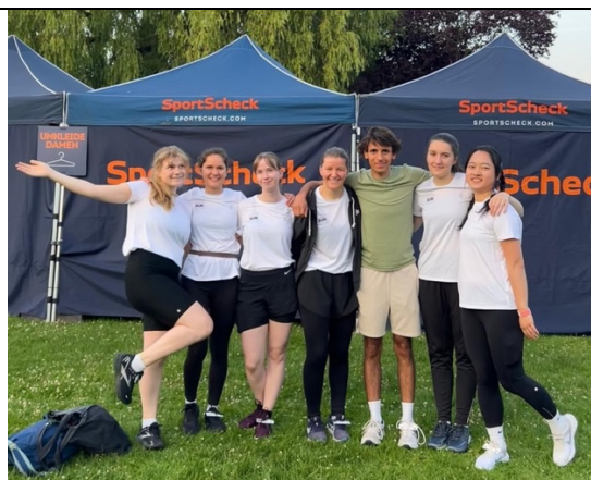
與同學們參加漢堡的夏日環湖路跑