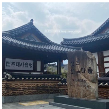
全州韓屋村（可租借韓服拍照）