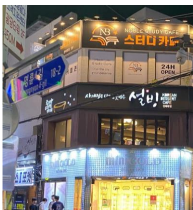
全北大學舊正門商圈