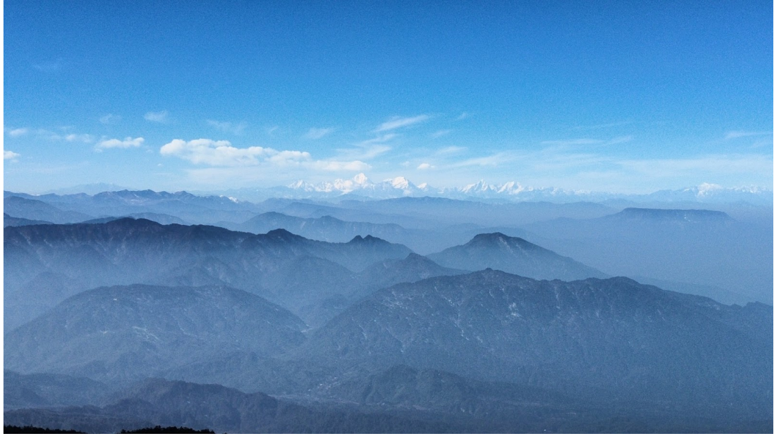
圖13：在峨眉山上看到的蜀山之王—貢嘎雪山