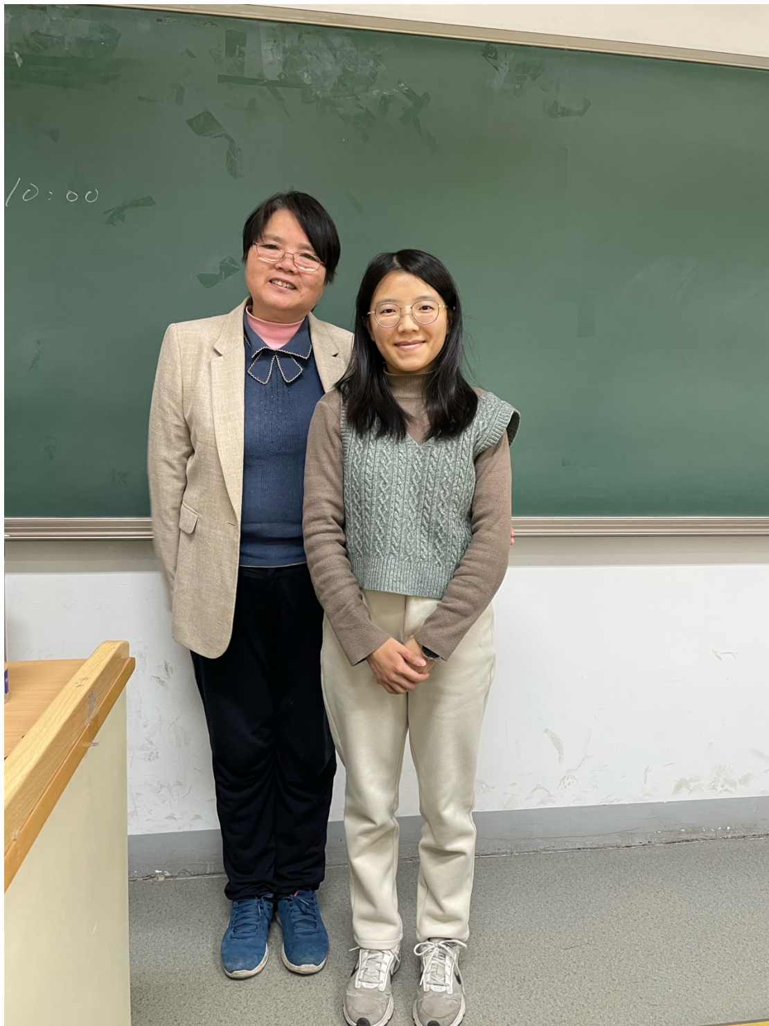
圖4：與建築與神話的教授合影