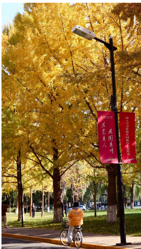
圖6：金秋的人大校園