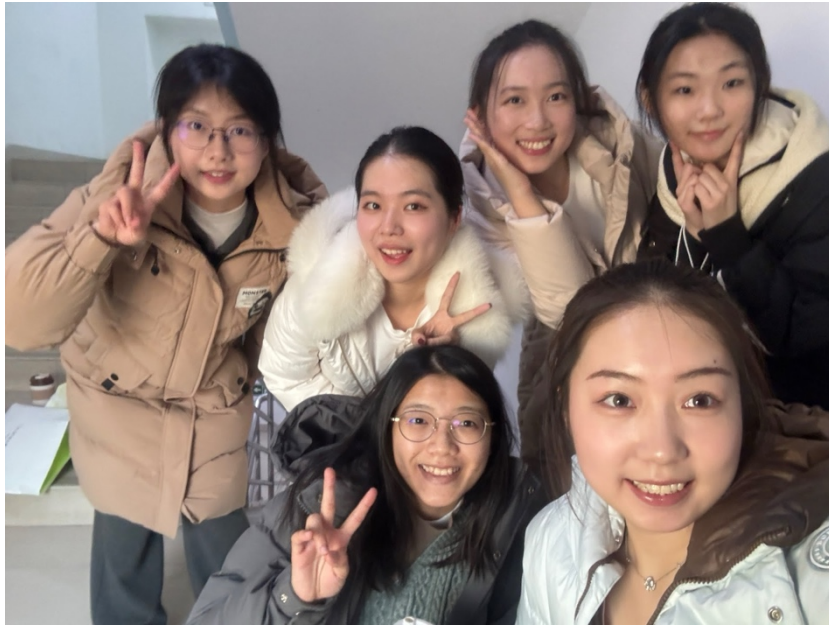
圖3：中國民間舞蹈課上分組結識的中國同學們