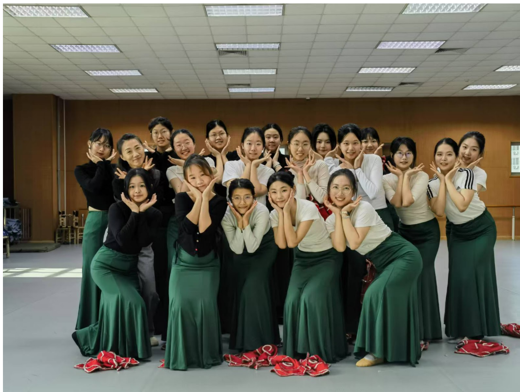
圖2：選修課程-中國民間舞蹈，團體成果與授課老師的合照