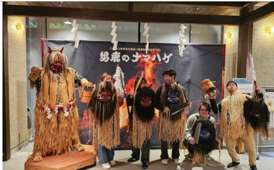
Bus Trip 生剝鬼節 博物館