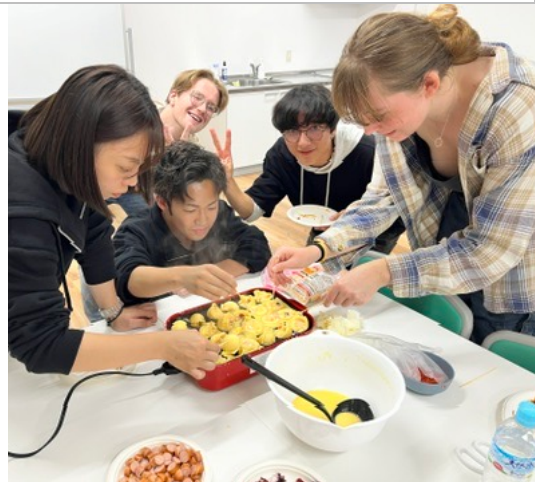
宿舍活動-章魚燒派對