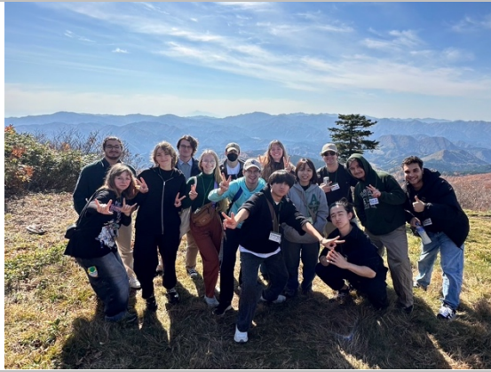
Bus Trip 阿仁滑雪場纜車