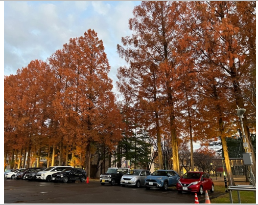
秋天的國際教養大學