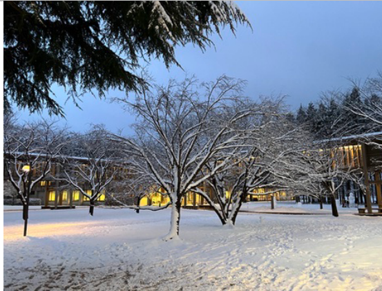
冬天的國際教養大學