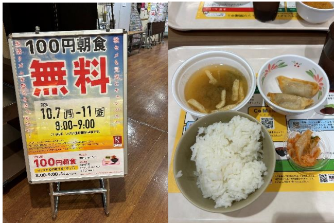
食堂百元早餐免費週 (平常100円也算便宜了)