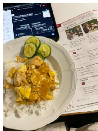
▲一些在哥廷根的日常