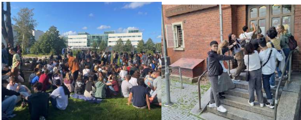
ESN 野餐/check point 活動