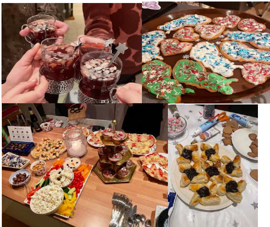
芬蘭獨立日一起做薑餅/喝 Glögi/Joulutorttu 聖誕節的風車點心