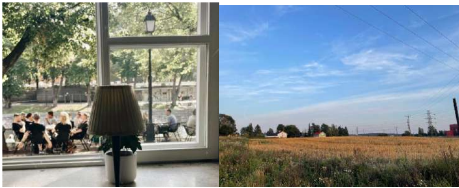
享受自然風光的當地人/夏天的土庫