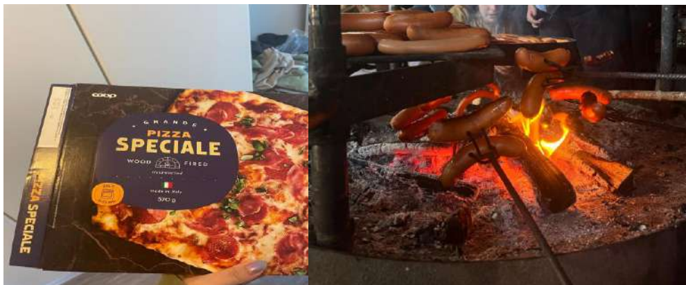
超市最好吃的冷凍披薩/健行森林裡烤香腸