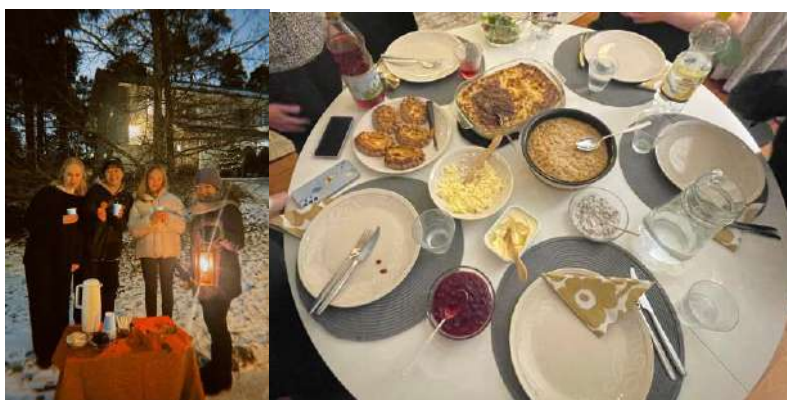
聖露西亞節/與芬蘭家庭吃芬蘭菜