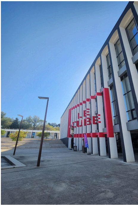
學校活動中心(保健室在這)