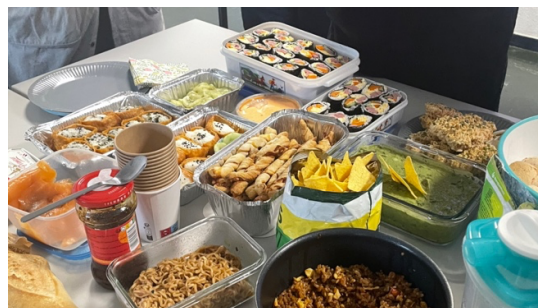
▲ 語言中心班級活動-美食交流