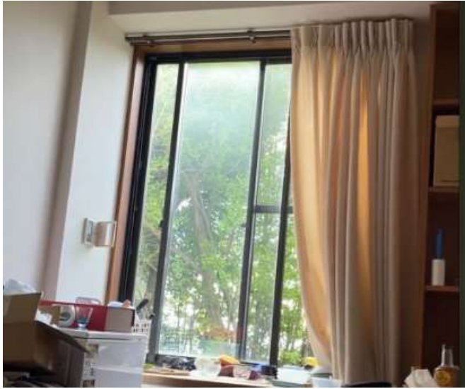
宿舍一個月約一次的活動