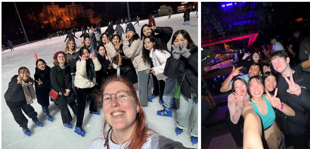
(參與 ELB 舉辦的活動)