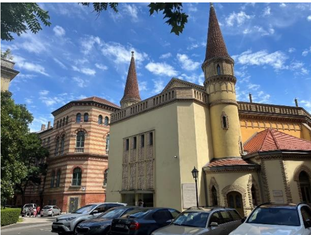
（羅蘭大學人文藝術學院校園內部）