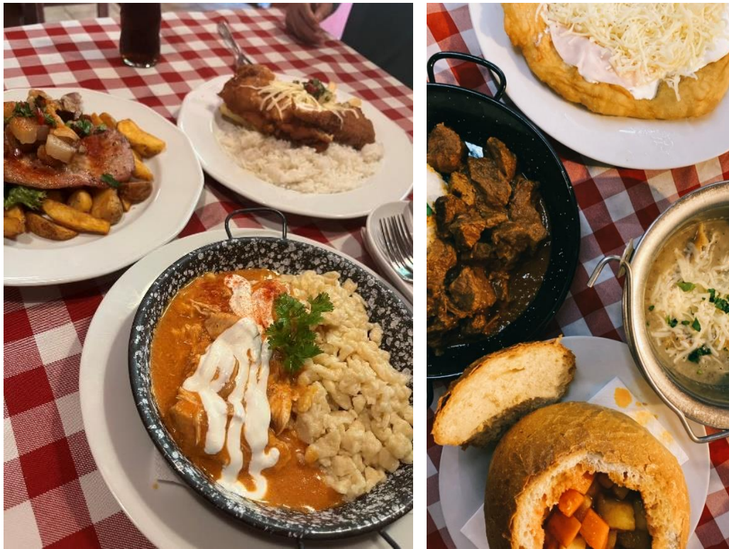
(匈牙利餐廳 Tüköry Étterem 與其他匈牙利料理)