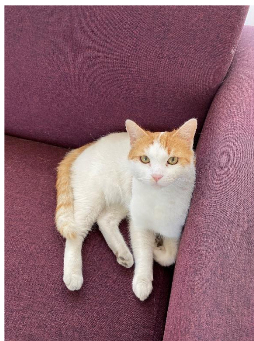
(宿舍共用廚房與宿貓)