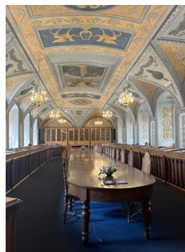
一進去就會覺得自己 變厲害的舊圖