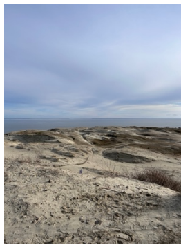
尼達 也很遠但漂亮！