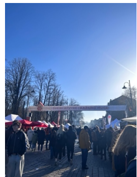
手工織品節 超級多小吃超熱鬧