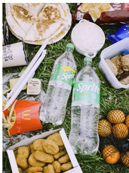
春天去賞櫻花順便野餐 (但忘記拍花了)