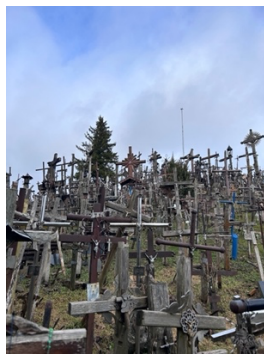
十字架山 偏難到但很值得