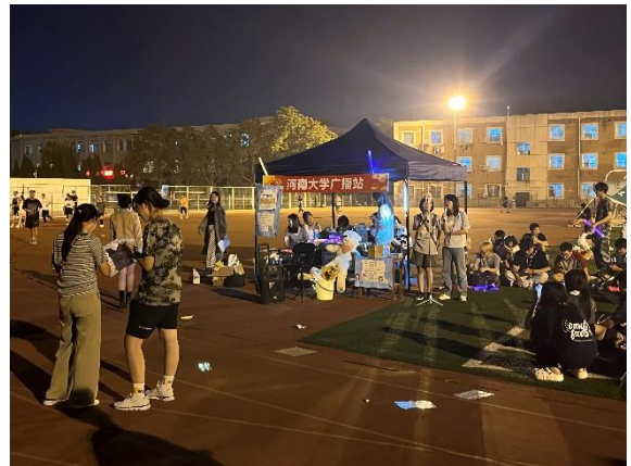
校園操場活動 (社團招生)