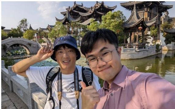
第一次中國出遊 (河南 朱仙鎮)