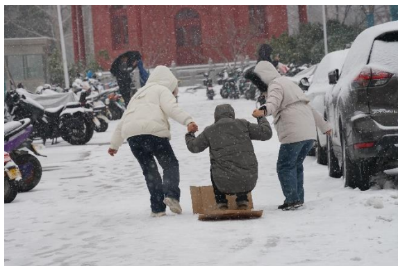
河南近幾年最冷的天氣 (第一次生活的地方下雪)