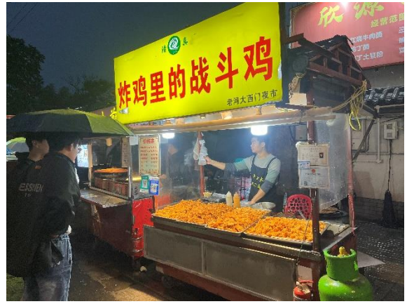
學校旁的夜市 (西門夜市)