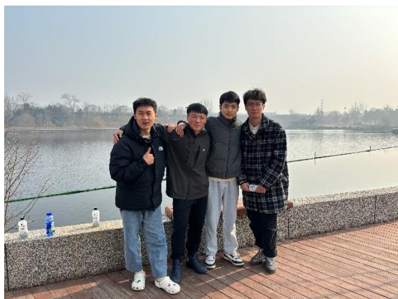
一學期的室友們 (學7宿 117房)