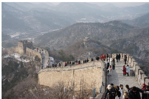
萬里長城_八達嶺 (北京)