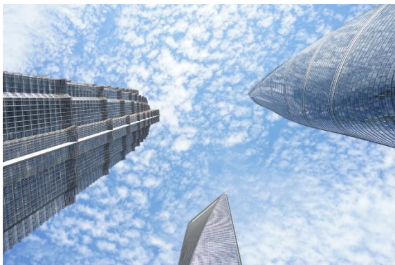
上海景點 (上海三件套)