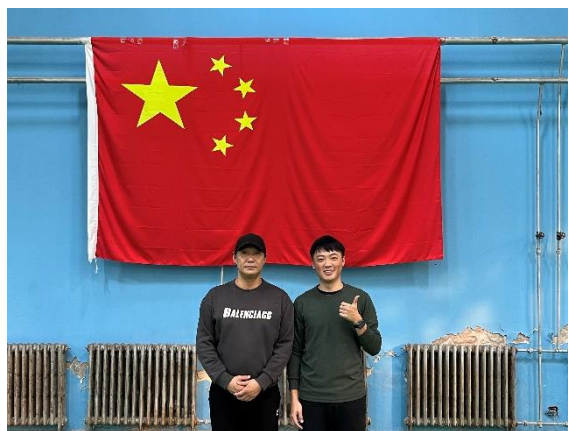
一學期的羽球教練