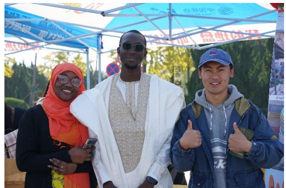
校園活動_國際文化節