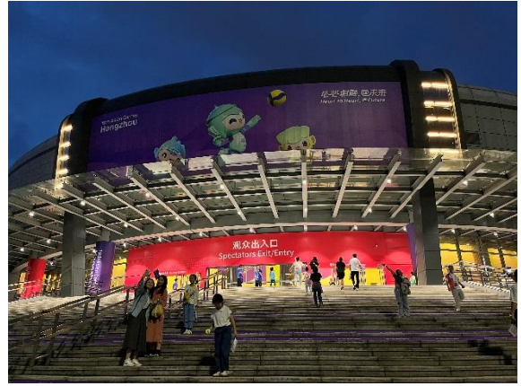
人生第一場亞運賽事 (女排 中華臺北 v.s 蒙古)