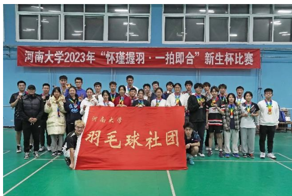
校園活動_羽球新生盃 (男子雙打冠軍)