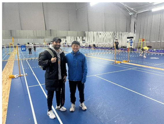
來至國際的球友 (巴基斯坦)