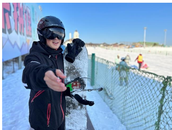
滑雪活動 (單板初體驗)