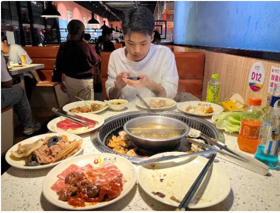
在國外過的第一個中秋節 (體驗中國的燒烤)