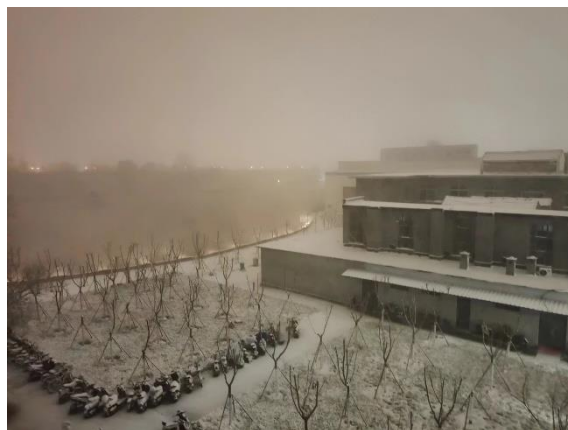
河南冬天的第一場雪 (從宿舍拍下去白白一片)