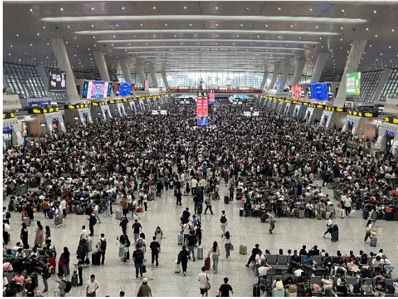
體驗中國的黃金週 (杭州東站)