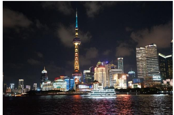
上海外灘 (東方明珠塔)