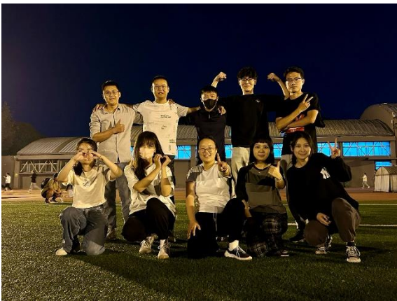
校園活動_拔河 (系所運動會)