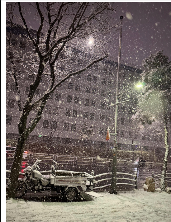
第一次遇到這麼大的雪 很美同時也很冷