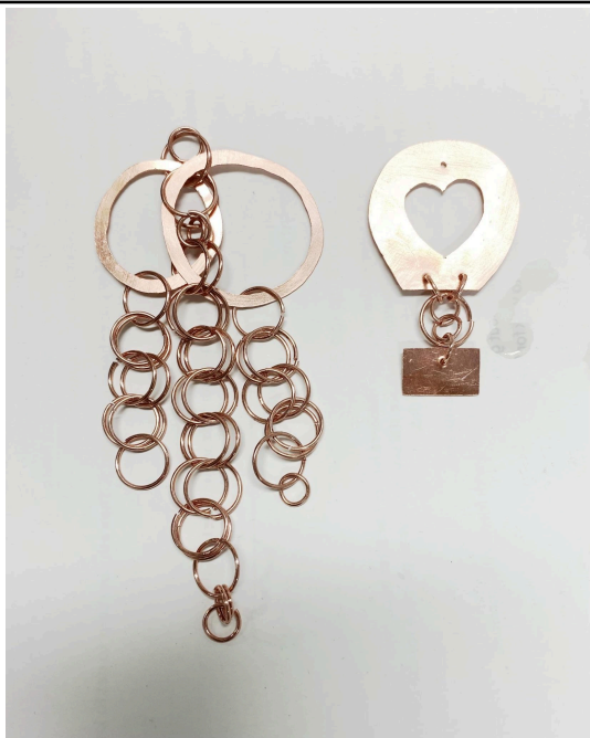
珠寶設計的設計模型