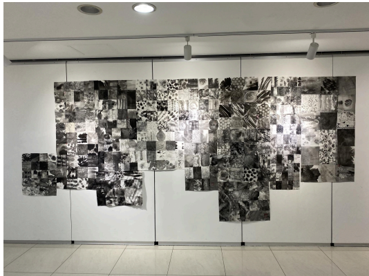
水墨課學期末全班的展覽

照片3-6張 (請提供課程或校園等學習活動之照片, 或校外活動之照片亦可, 並請備註)