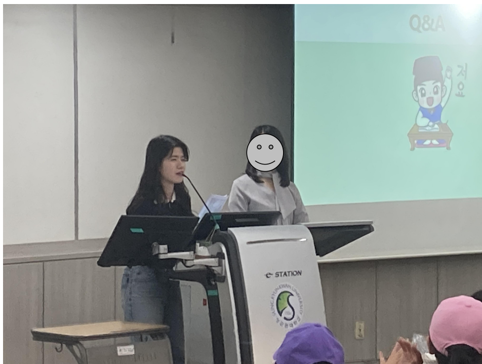
▲上圖為我在第二期開始之前，協助成均館語學堂進行新生訓練的畫面。新生訓練過程中，會和新生分享辦理外國人登錄證、開通銀行帳戶等事項，為初來韓國的同學們提供基本生活資訊，希望能協助大家更快速適應。