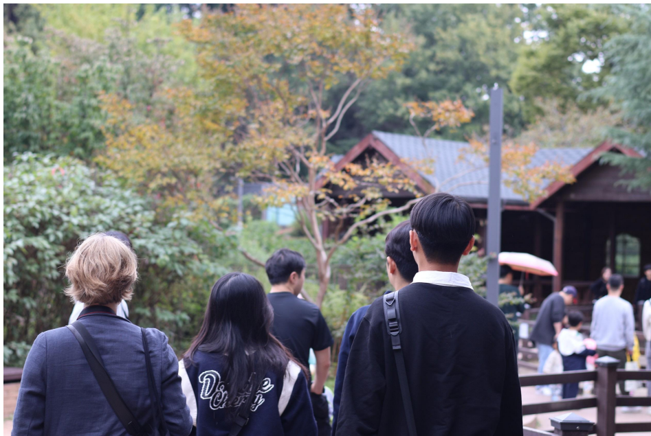
▲圖為和攝影社同學們一起到兒童大公園所拍攝的照片，社團除了韓國同學之外也有其他交換生，是可以多多互動、交流文化以及為韓國生活留念的好機會。