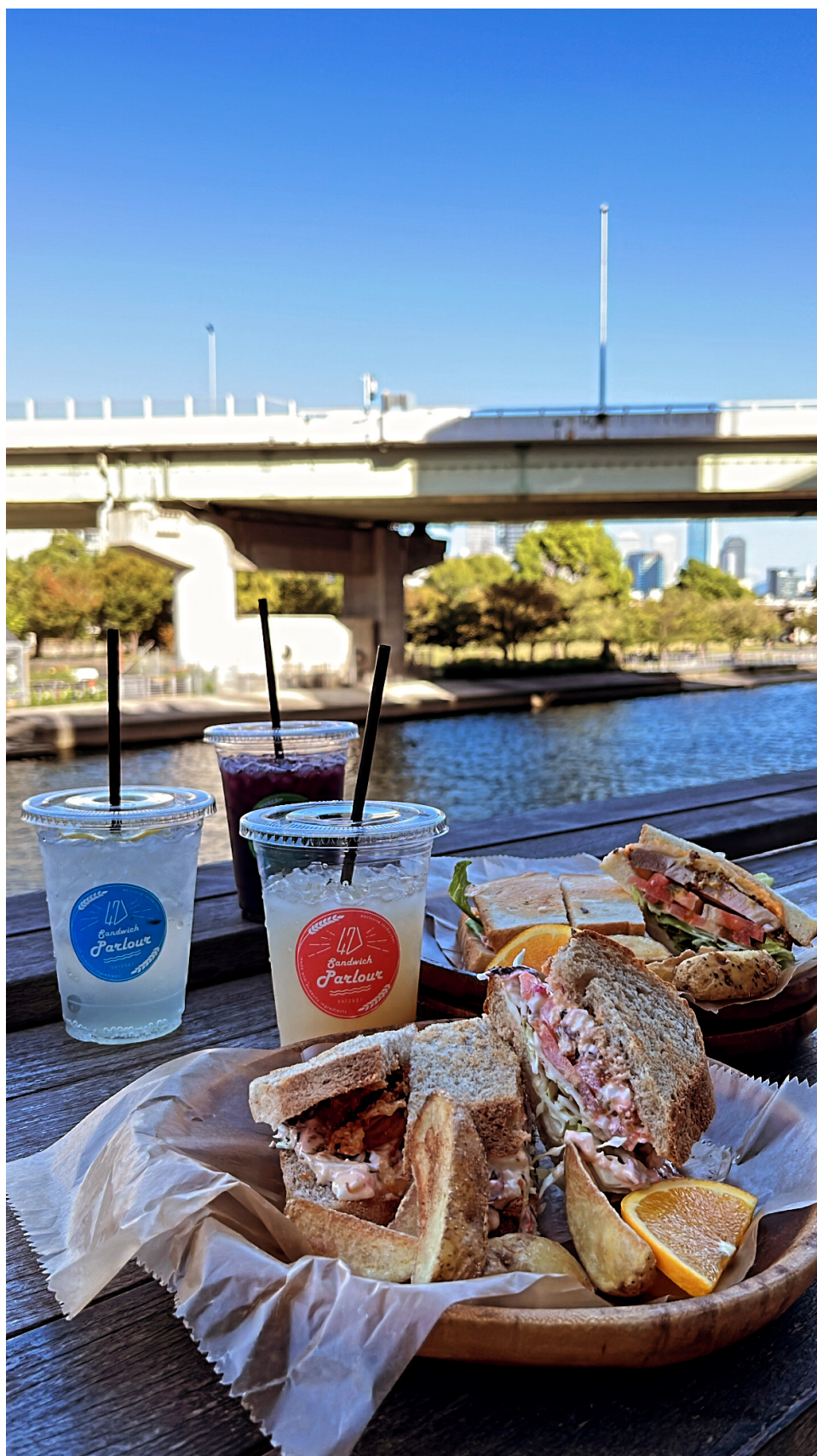
(北濱一間我很喜歡的咖啡廳，飲料普通但三明治好吃，店員很親切) 其他吃喝玩樂的照片太多了，就先這樣，有其他想要詢問或推薦的店可以善用