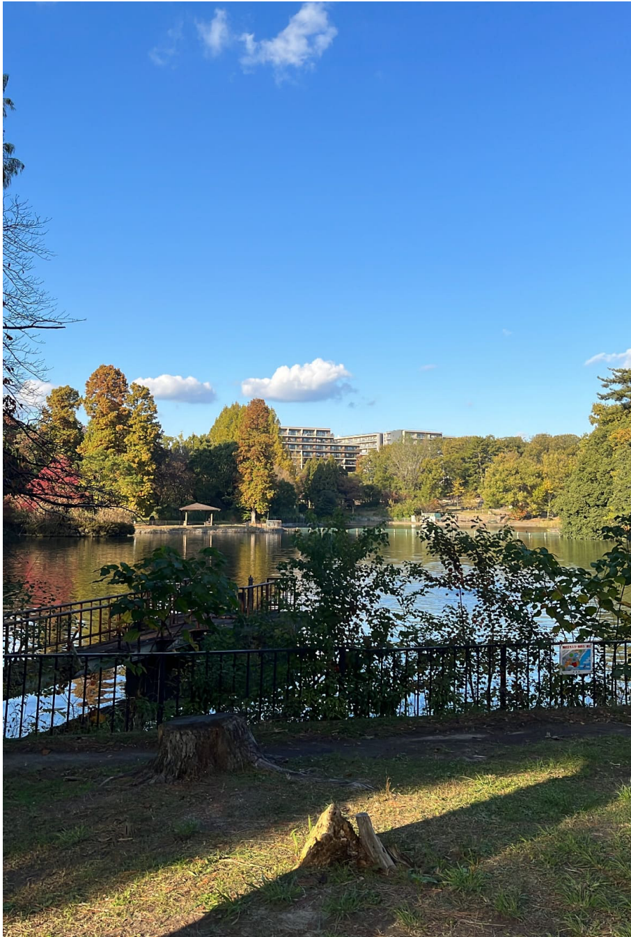
(南千里公園の某一塊)