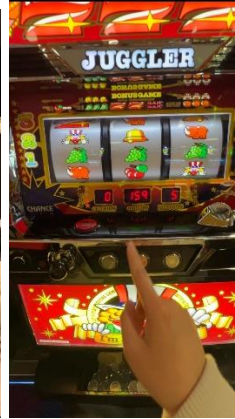
日本麻將、日本溫泉、小鋼珠