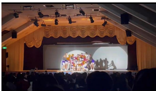
啦啦隊文化祭表演