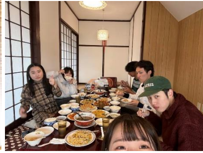
認識的日本朋友們