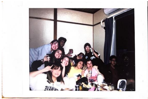
跟其他外國留學生的烤肉派對、跨年派對、生日派對