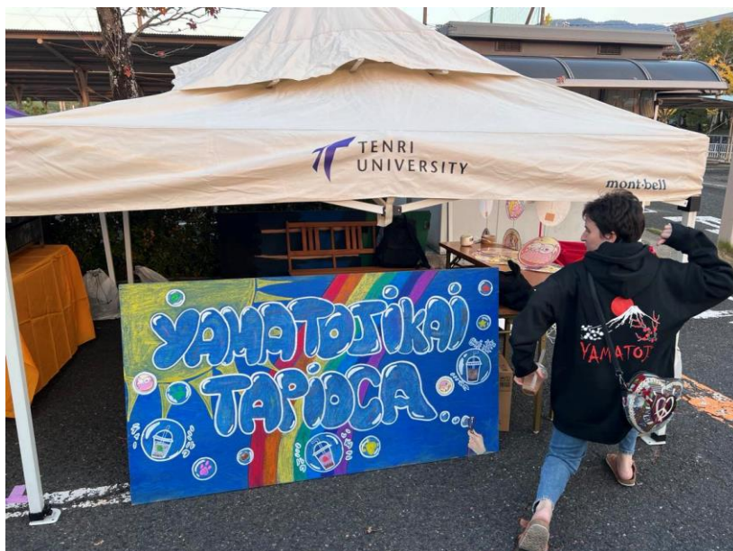
文化祭-大和路會の珍奶攤販