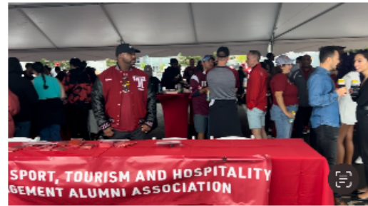
圖2. 天普運休學院校友會