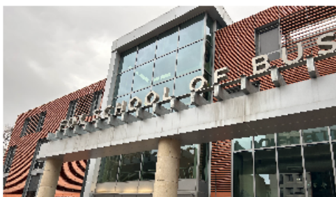
圖7. Fox School of Business 所在的 Speakman Hall 是我上課的地方