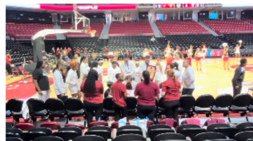
圖6. 天普女籃於學校 Liacouras Center 比賽