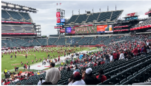
圖1. 參加Temple Homecoming