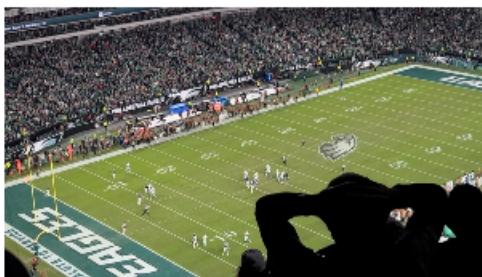
圖5. 觀看費城老鷹隊美式足球賽