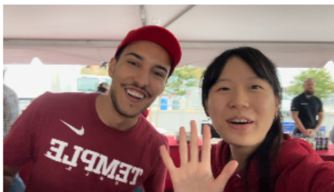
圖3. 與巴西student vlogger 參加天普的 Tailgate party