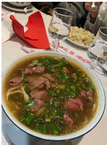
（越南餐廳 Sinh Ky）