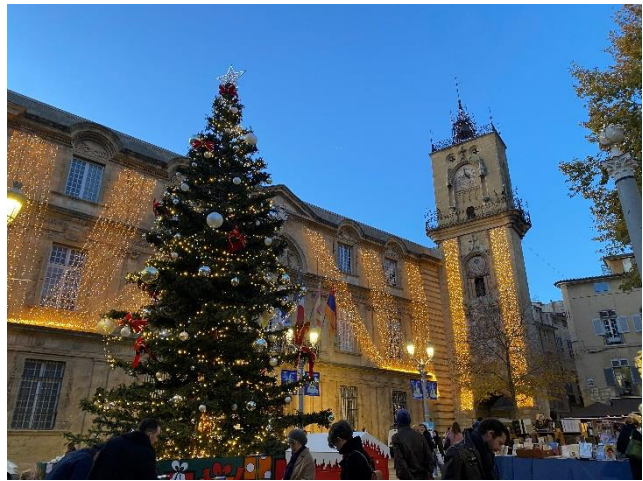
(艾克斯的聖誕氛圍)