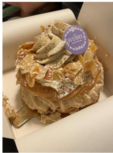
（甜點店 Maison Weibel）