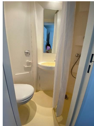
（宿舍 Les Gazelles）