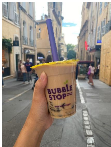
（珍奶店 Bubble Stop）