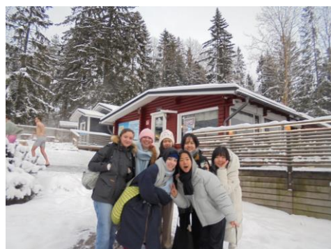
到芬蘭必須體驗的桑拿冰泳