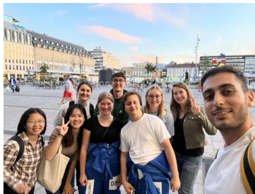
ESN 活動是很好認識其他人的時機