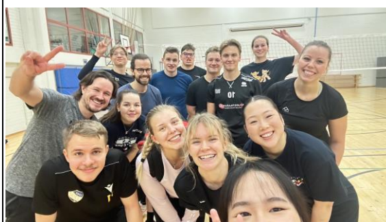
Campus Sports 推薦大家 運動有助交友與身體健康!