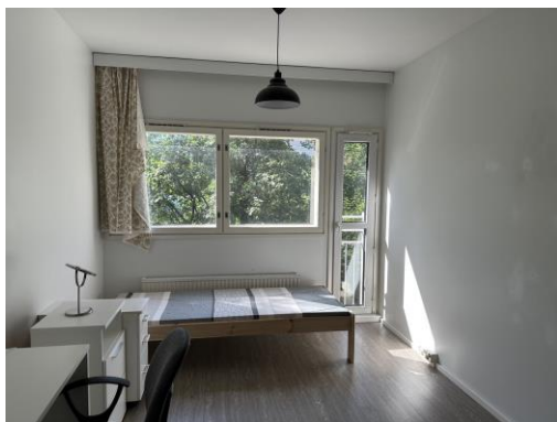
Student Village East 房間