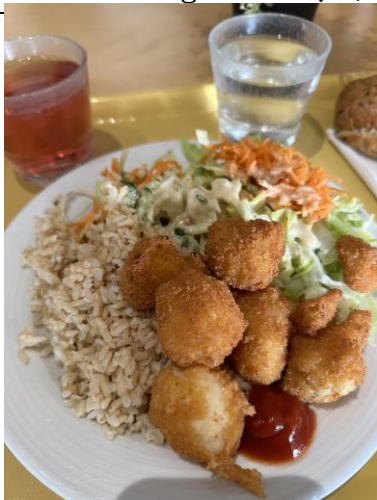
回台灣之後念念不忘的學餐