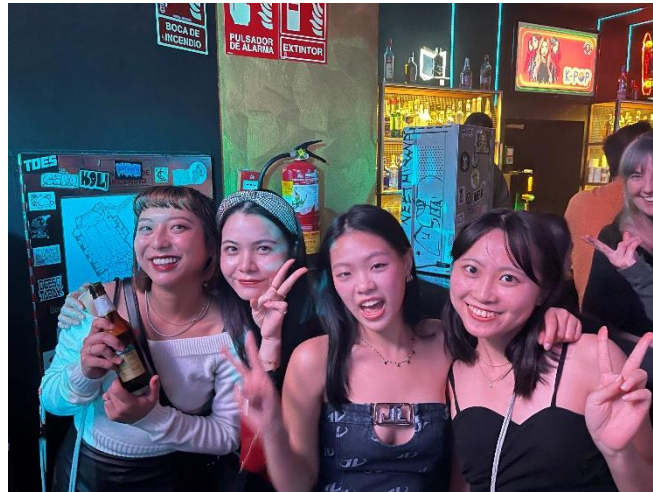
圖五・跟台灣朋友去馬德里的夜店