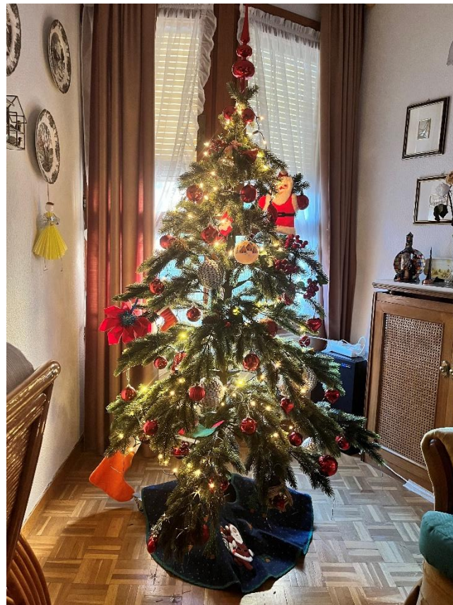
圖三・寄宿家庭中的聖誕樹

住在傳統西班牙人家的好處之一就是可以第一手體驗到當地的傳統文化，聖誕節前夕房東奶奶還把我拉到客廳去看聖誕樹跟介紹其他的傳統裝飾給我。