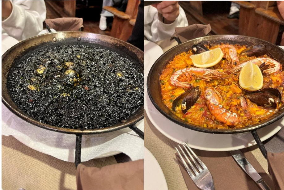
圖四・西班牙海鮮燉飯