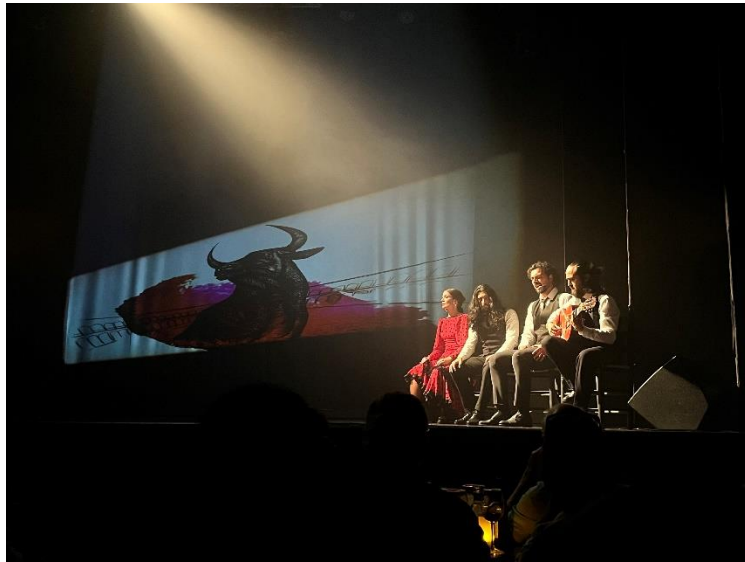
圖二・傳統的佛朗明哥舞表演

住在傳統西班牙人家的好處之一就是可以第一手體驗到當地的傳統文化，聖誕節前夕房東奶奶還把我拉到客廳去看聖誕樹跟介紹其他的傳統裝飾給我。