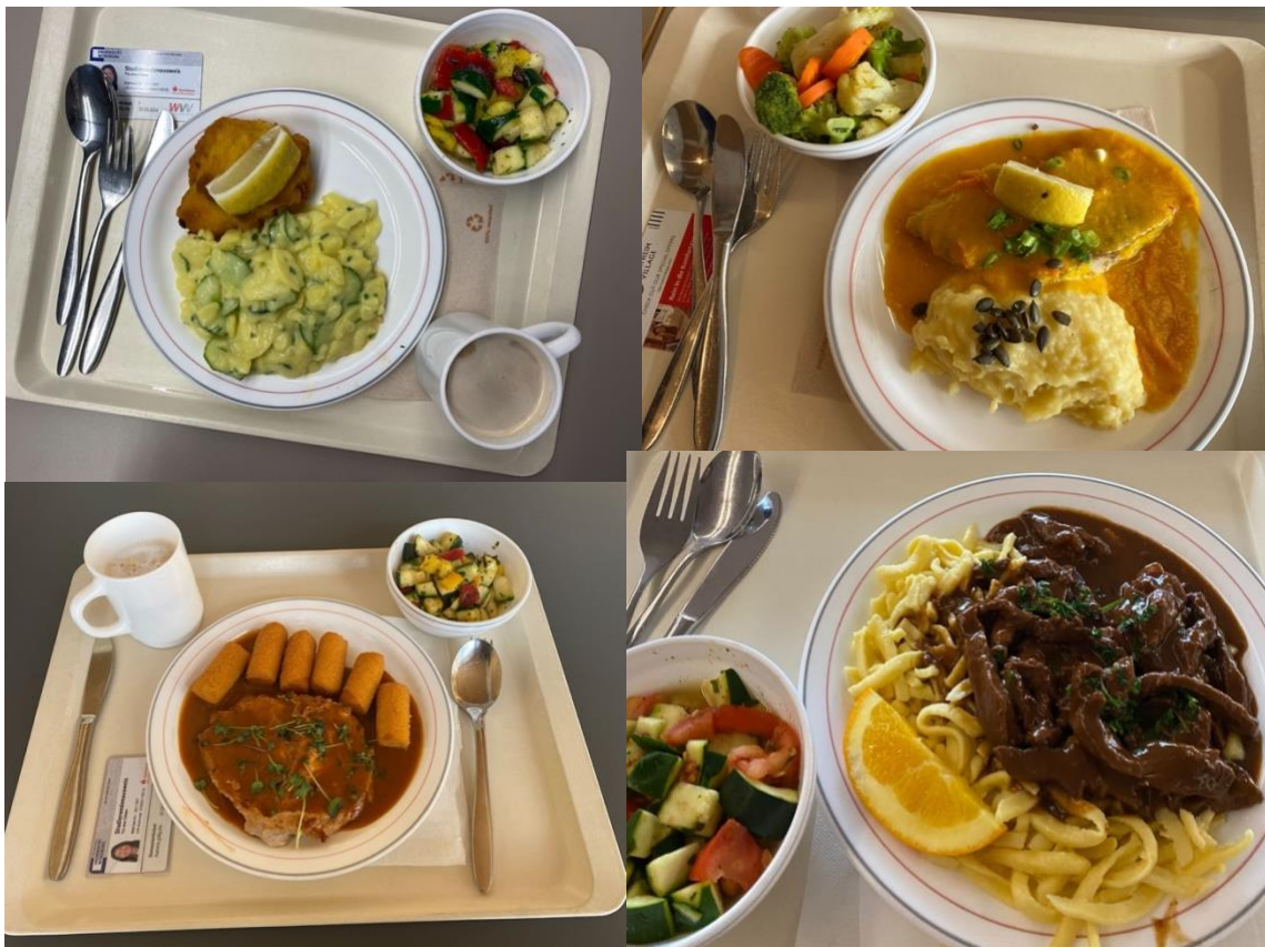
（學生餐廳 Mensa 的一些菜色）