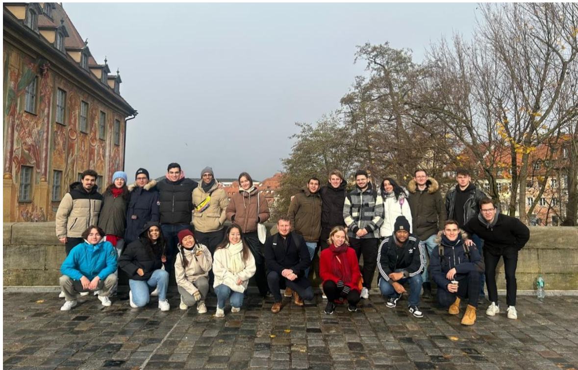
11月 Bamberg, 煙燻啤酒很有名。