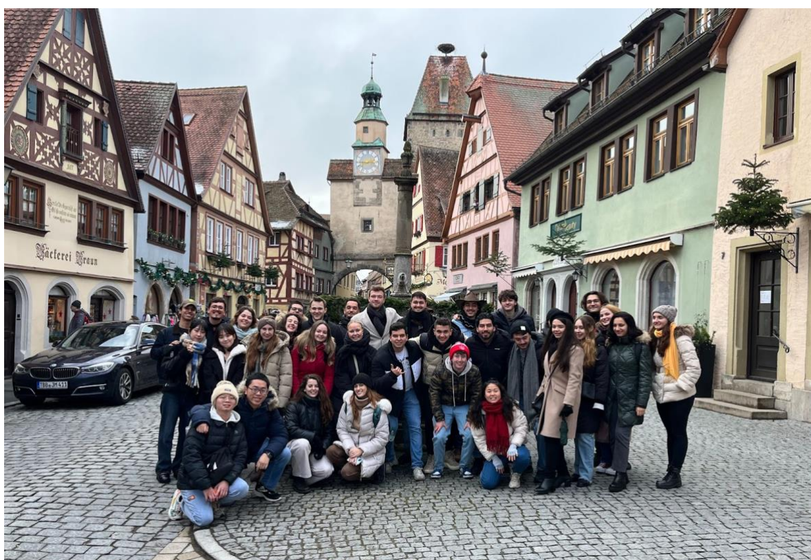
12月浪漫小鎮 Rothernburg 很可愛, 聖誕市集好逛。