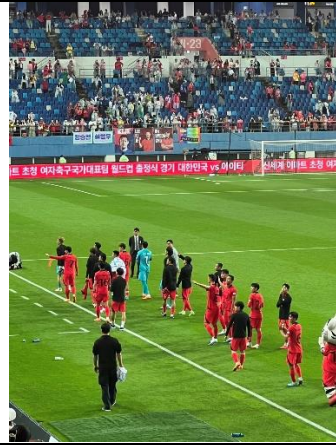
韓國足球國家隊，包含孫興慜. 曹圭成等明星球員，到大田世界盃競技場踢友誼賽