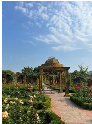
植物園，緊鄰新世界百貨，值得一逛