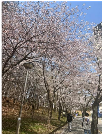
校內櫻花盛開景況，也會舉辦櫻花慶典