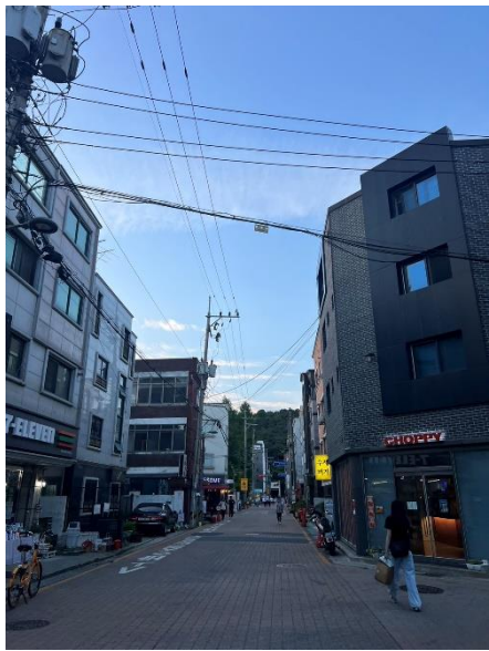
學校側門出去的弓洞商圈