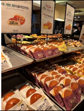
大田名產-聖心堂麵包！招牌是菠蘿麵包