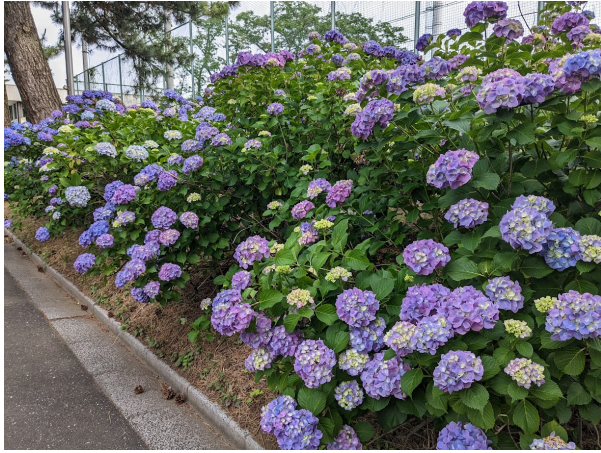
游泳池對面的繡球花叢(六月)