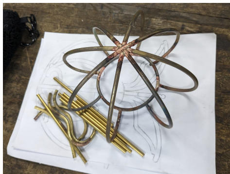
美術演習課的金工燭台製作中