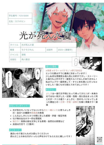
講讀期末報告:作品介紹