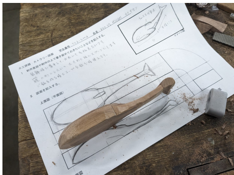
工藝演習課堂製作的木工湯匙