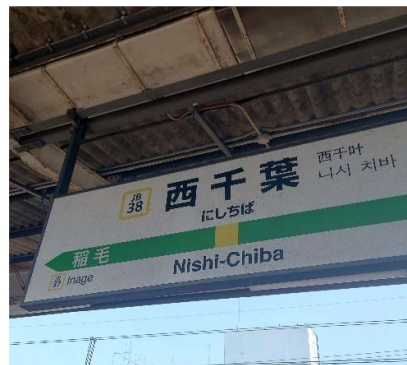
離學校最近的 JR 西千葉站