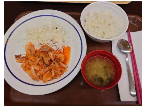
飯類學餐的泡菜豬肉600多日幣