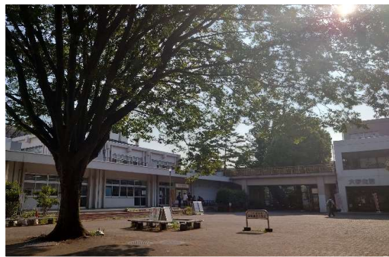
life center 前的廣場 (午休常常有各種社團表演)