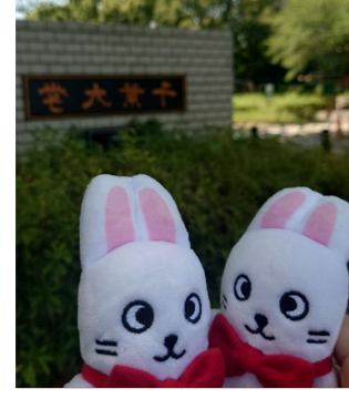
西千葉校區的代表獸にし