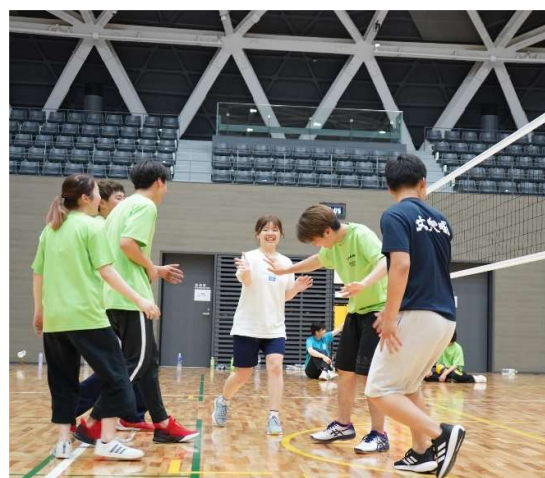
バレーボールサークル CHANGE