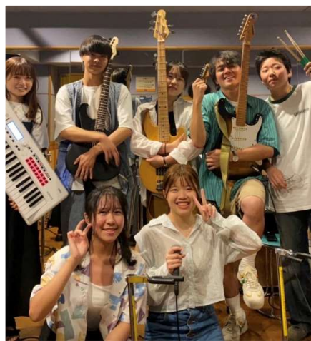
輕音サークル Sound house zoo