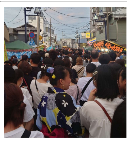
稻毛淺間神社祭典