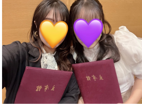
SKP 學程會在校內演講廳舉辦結業典禮，自由參加。學程結束會給予右圖所示精緻的結業證明一份，好讚。