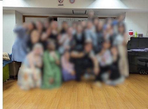
左圖為常盤宿舍房間，這間位於3樓的邊角，據說這個位置的房間是最大的，而且有兩扇窗。雖然採光很好但西曬嚴重，窗簾也不遮光。宿舍外有一條河，所以蚊蟲滿多的，衣服曬在外面要注意。右圖為常盤宿舍的歡送會，平常大家會聚在起居室寫作業或聊天，週五晚上常有活動，這裡也有電視可以看。