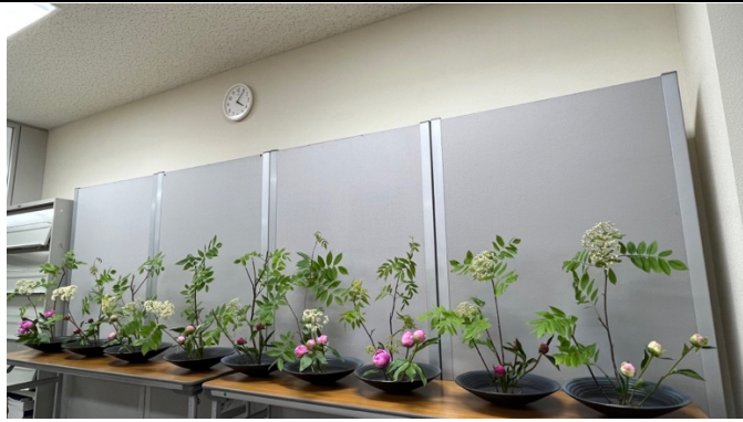
左圖是某次插花課的作品；右圖為班級全員的作品。