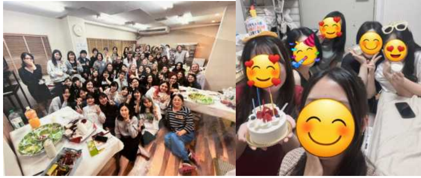
宿舍歡迎會；跟台灣同學們在宿舍一起慶生。