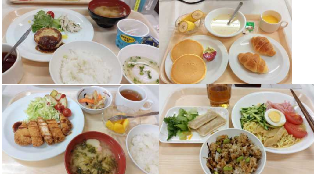
宿舍早餐和晚餐，每天都很豐盛均衡，早餐可選擇和式或洋式。