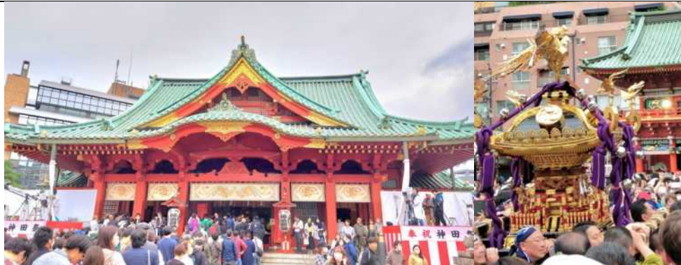
日本三大祭典之一的神田祭，睽違四年舉辦吸引大批人潮參與。