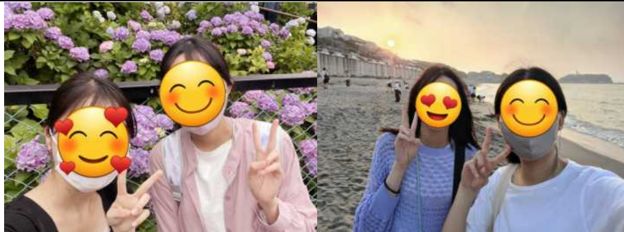
跟韓國朋友到白山神社欣賞繡球花祭；跟喜歡灌高的韓國朋友看完應援場就約定好要來鎌倉海岸朝聖。