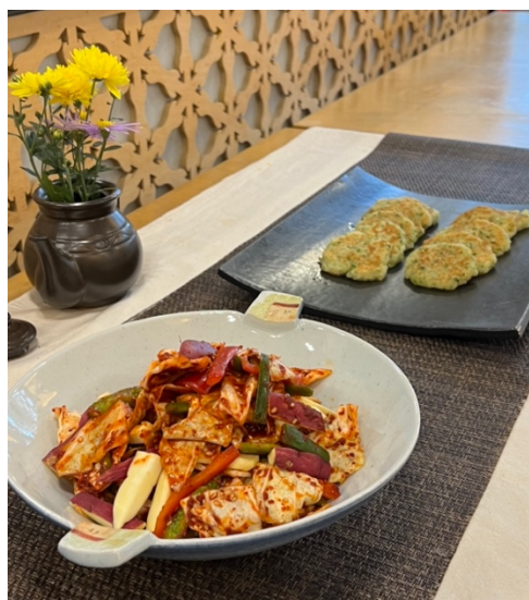
交換生寺廟飲食活動