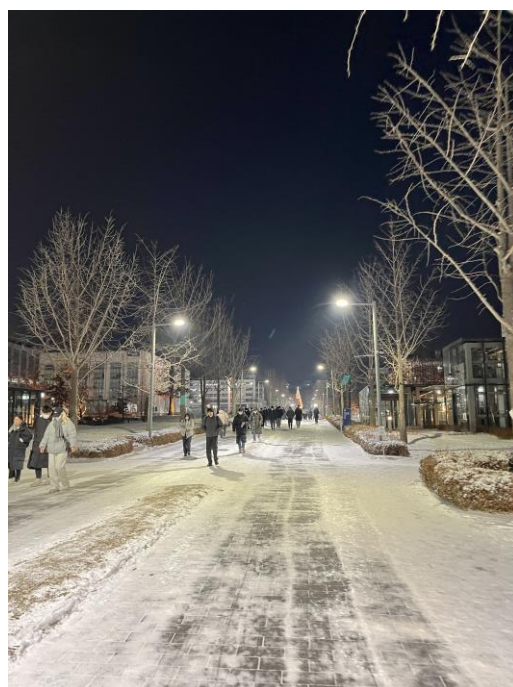
不同季節的延世校園景色