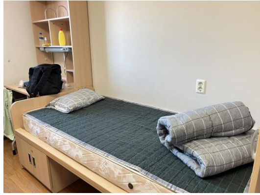
SK Global House 雙人房