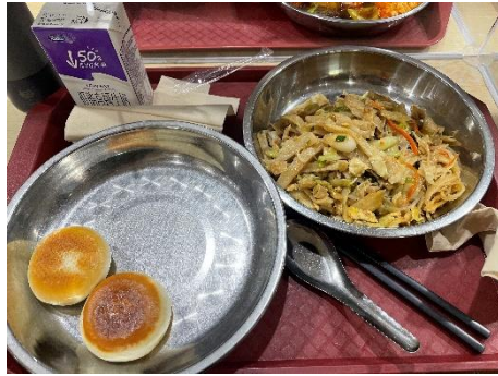
(鍋包肉、勺園紅糖鍋盔推推)