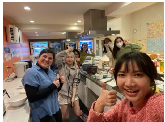
和宿舍同學一起參與富士電視台的網路節目拍攝