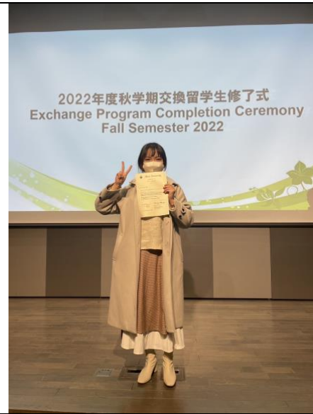
交換留學生結業式