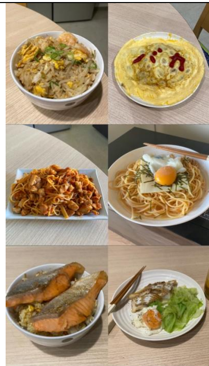
那幾年我煮的外表醜陋可是好吃的食物們