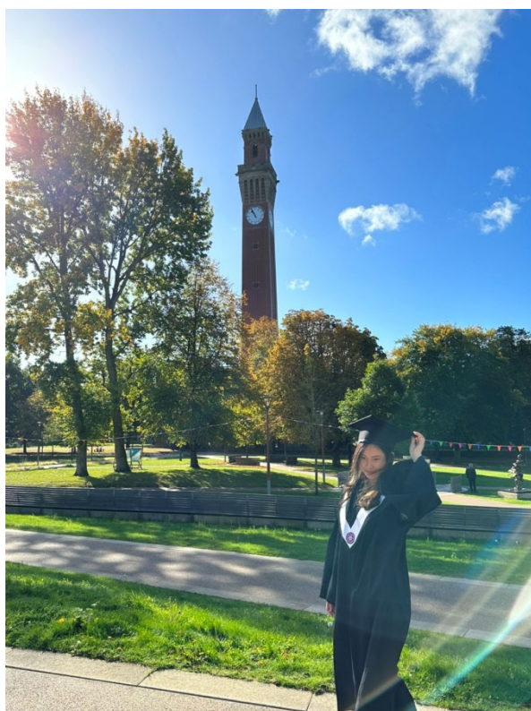
↑ 校園 →