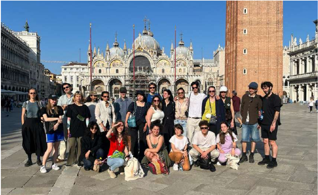
前往參觀威尼斯雙年展班級合照

除了心靈層面與學習層面，我也獲得了很多朋友以及一些歐洲藝術圈的人脈。更因為體驗很好，覺得成長了許多所以選擇延長一學期的交換學生，甚至打算讓整個體驗更完整，在今年申請到同所學校的碩士。